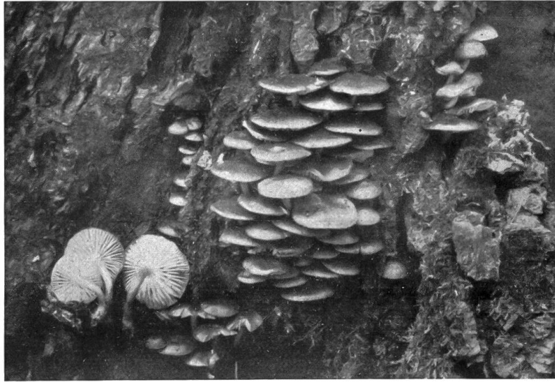
Winterhelmling, Mycena tintinabulum Fr.