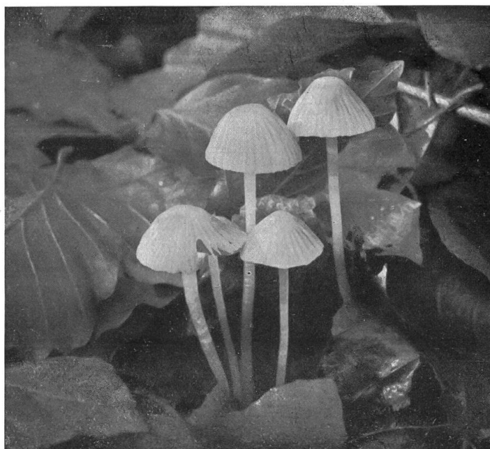
Geknieter Helmling, Myc. fagetorum Fr.