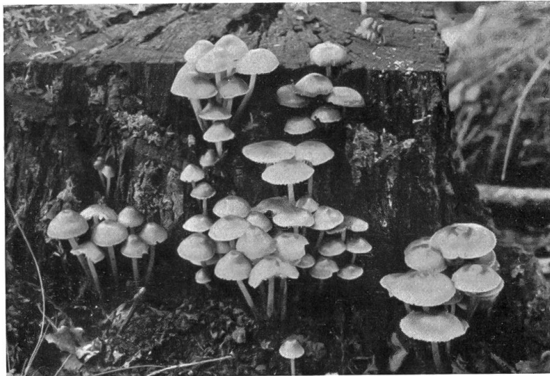
Rosablättr. Helmling, Myc. galericulata Scop.