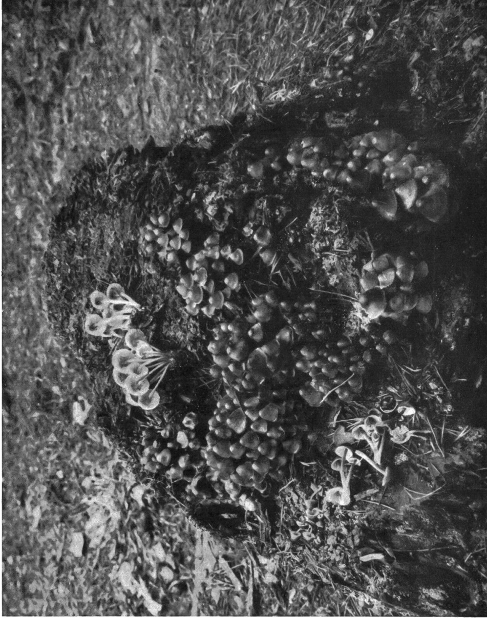
Alkalischer Helmling, Mycena alcalina Fr.