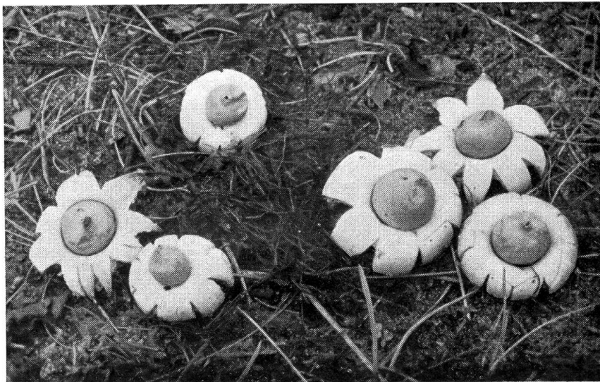
Abb. 4. Gewimperter Erdstern ( Geaster fimbriatus Fr.)