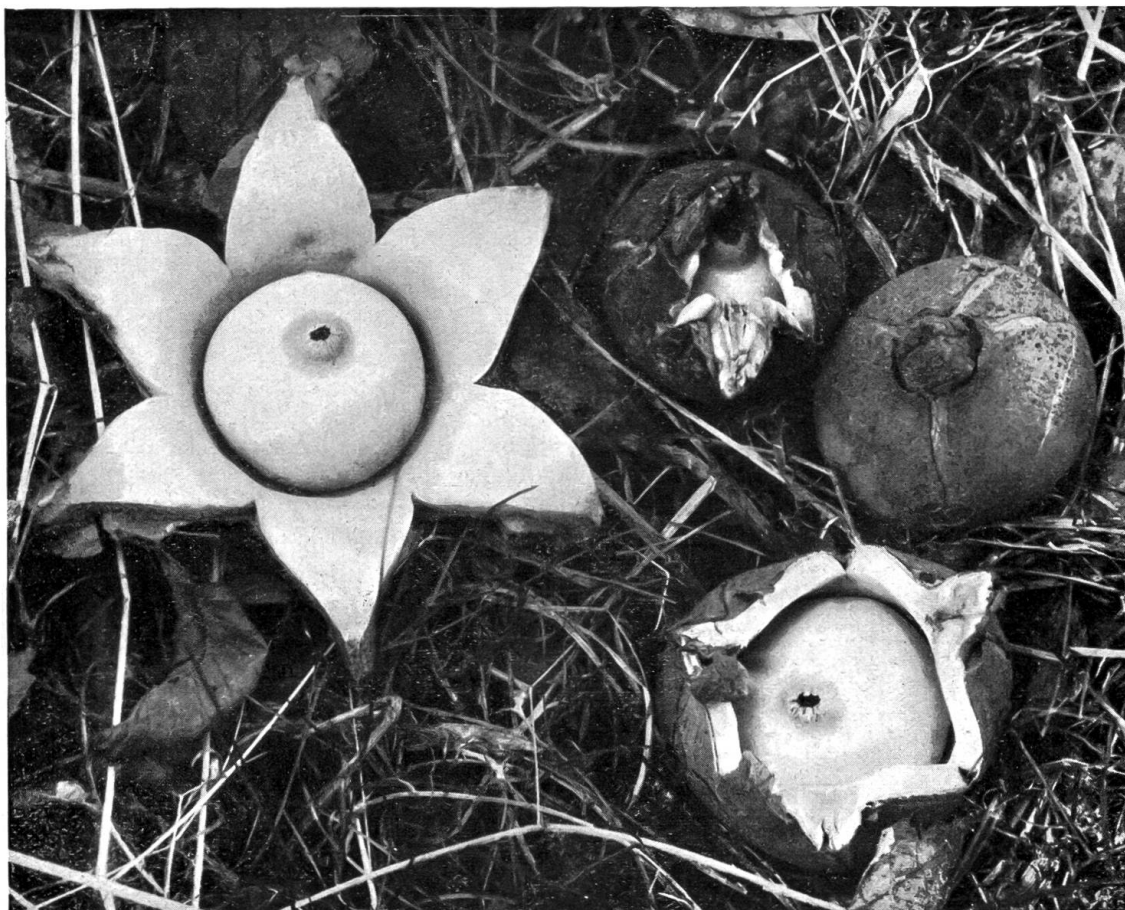
Abb. 1. — Halskrausen-Erdstern ( Geaster triplex ) beim Aufbrechen