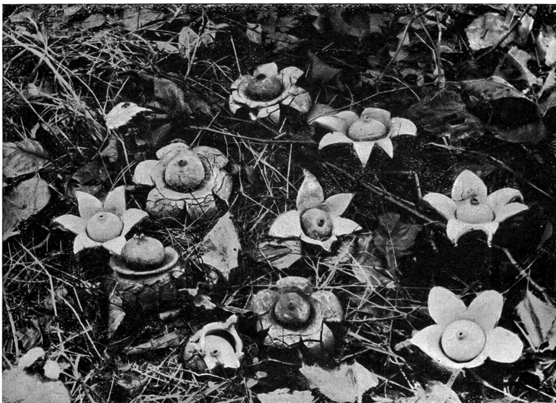
Abb. 2. — Halskrausen-Erdstern ( Geaster triplex ) in verschiedenen Entwicklungsstadien