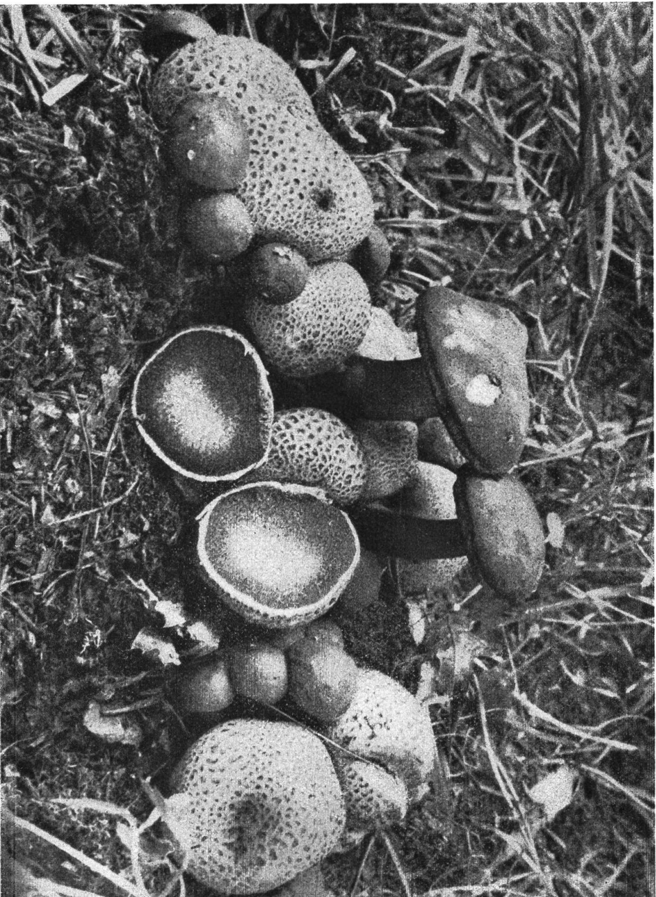
Schmarotzer-Röhrling, Boletus parasiticus Bull. auf Kartoffelbovist.