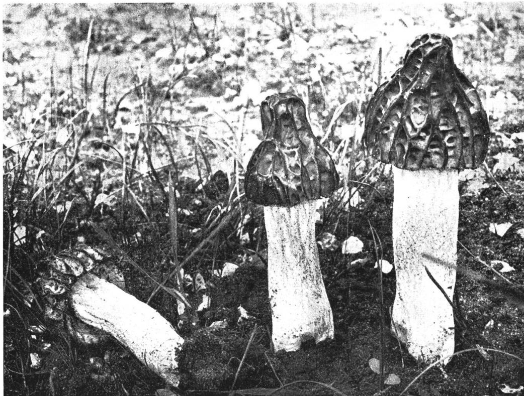
Abb. 1. Glockenmorchel oder Halbfreie Morchel ( Morchella semilibera D. C.).