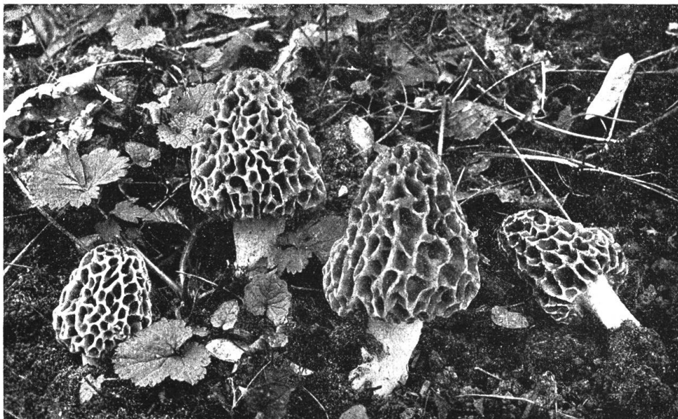
Abb. 2. Spitzhütige Form der Speisemorchel ( Morchella esculenta L.). In Pilzbüchern häufig als Spitzmorchel ( Morchella conica Pers.) bezeichnet.

Aufnahmen von Br. Hennig, Berlin-Südende.