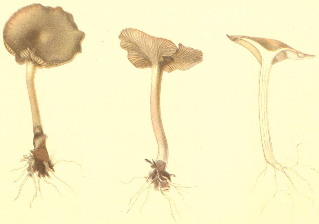
Clitocybe rhizophora (Velen.) Joss. et Pouch.