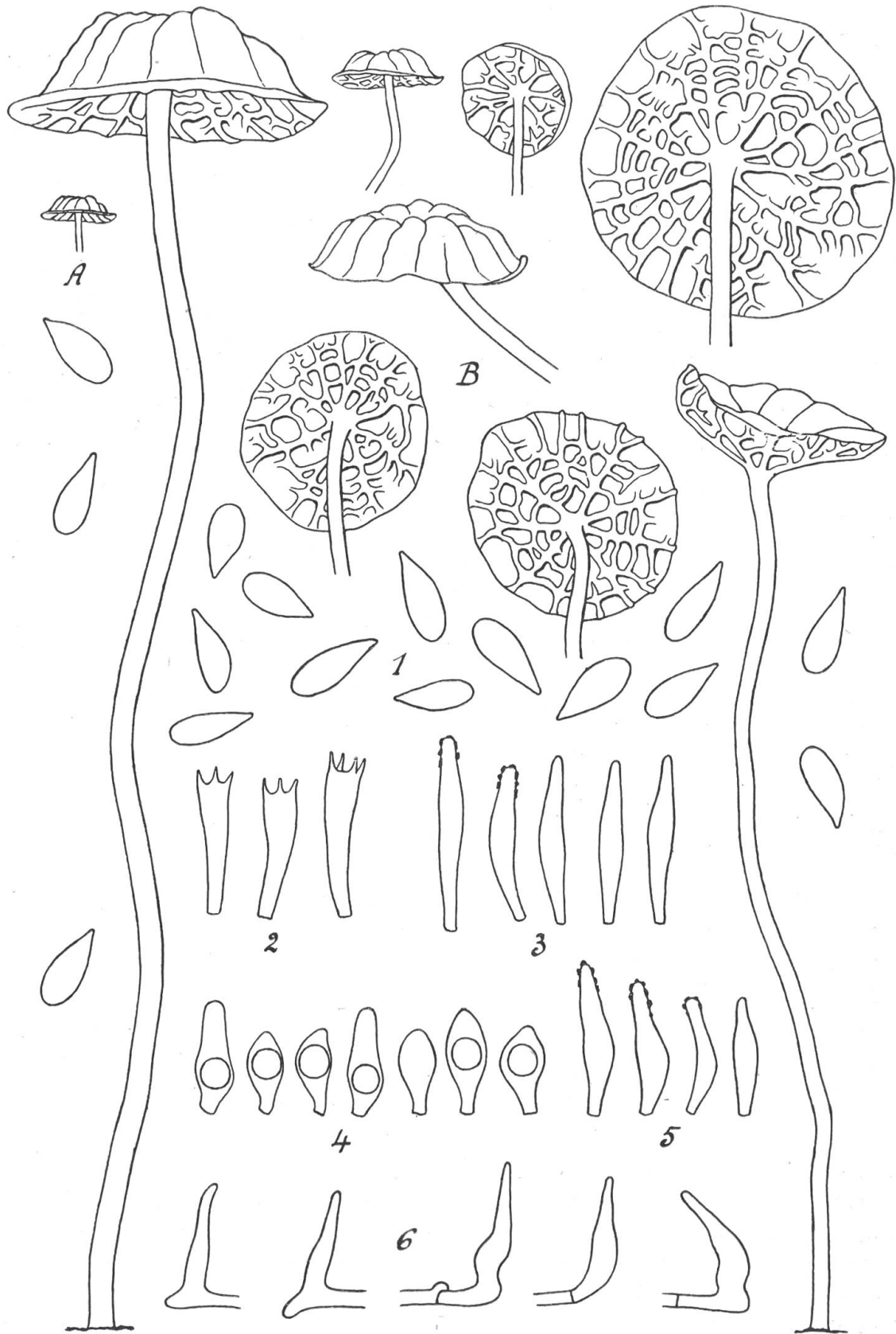
Fig.1 - Marasmius epiphyllus . - A, carpophore gr.nat., B, carpophores grossis 4 fois. - 1, spores \times 1000 ; 2, basides; 3, cheilocystides; 4, éléments du revêtement du chapeau; 5, pilocystides; 6, caulocystides; \times 500 .