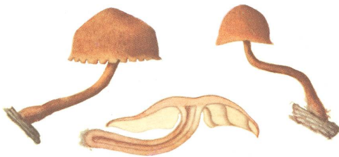
Gymnopilus satur Kühner