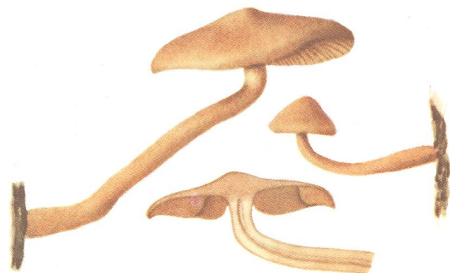
Gymnopilus subsphaerosporus (Joss.) K. & R.