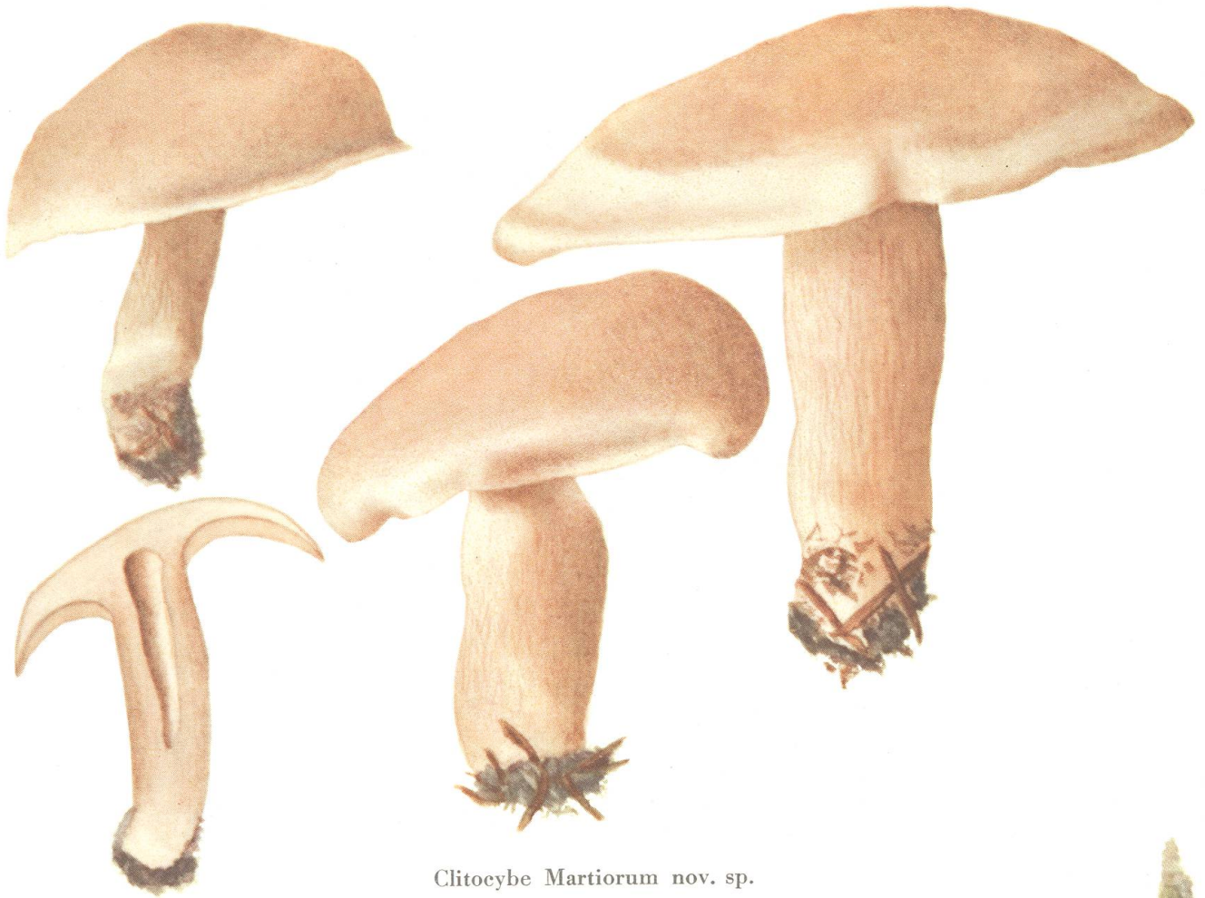
Clitocybe Martiorum nov. sp.