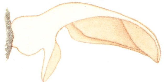
Panellus ringens Fr.