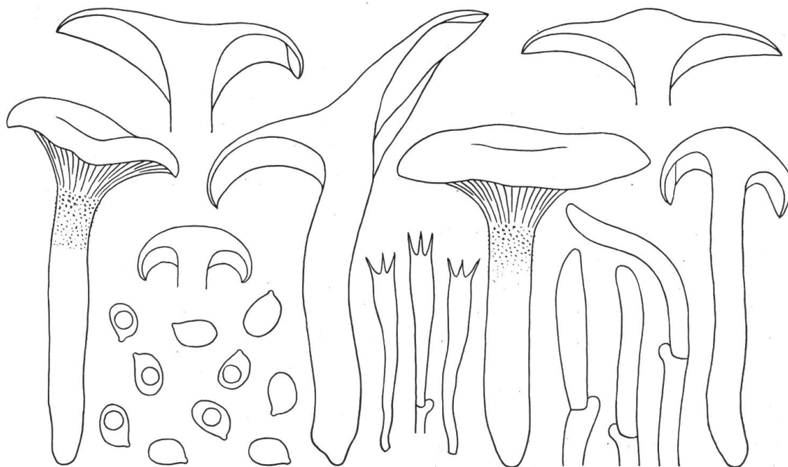
Fig. 5. Hygrophorus melizeus Fr. – Forêt de Vanel, près de Witzwil, entre Neuchâtel et Berne. – Carphores, gr.nat. Spores \times 1000 . Basides et hyphes des flocons du haut du pied \times 500 .