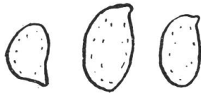
Fig. 2 2000 ×

Lamellen durchwegs freudig ockerorange, schließlich mehr nach Rostbraun verfärbend, schmaler oder breiter bauchig und hinten tief ausgebuchtet angewachsen, mäßig gedrängt, Schneide dünn, aber am Grund eher dicklich, am Grunde oft auch stark queraderig verbunden.