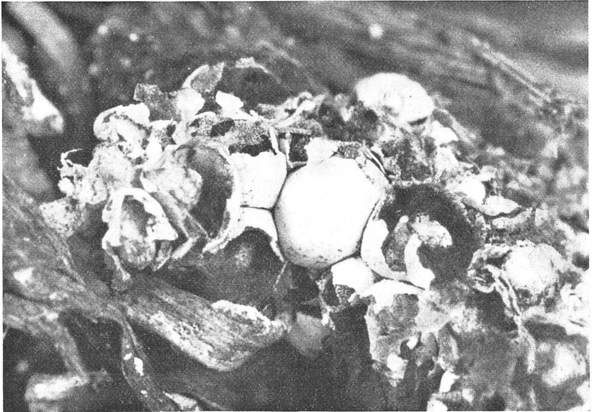
Fig. 1. Fruchtkörper (ca. 35mal vergrößert)