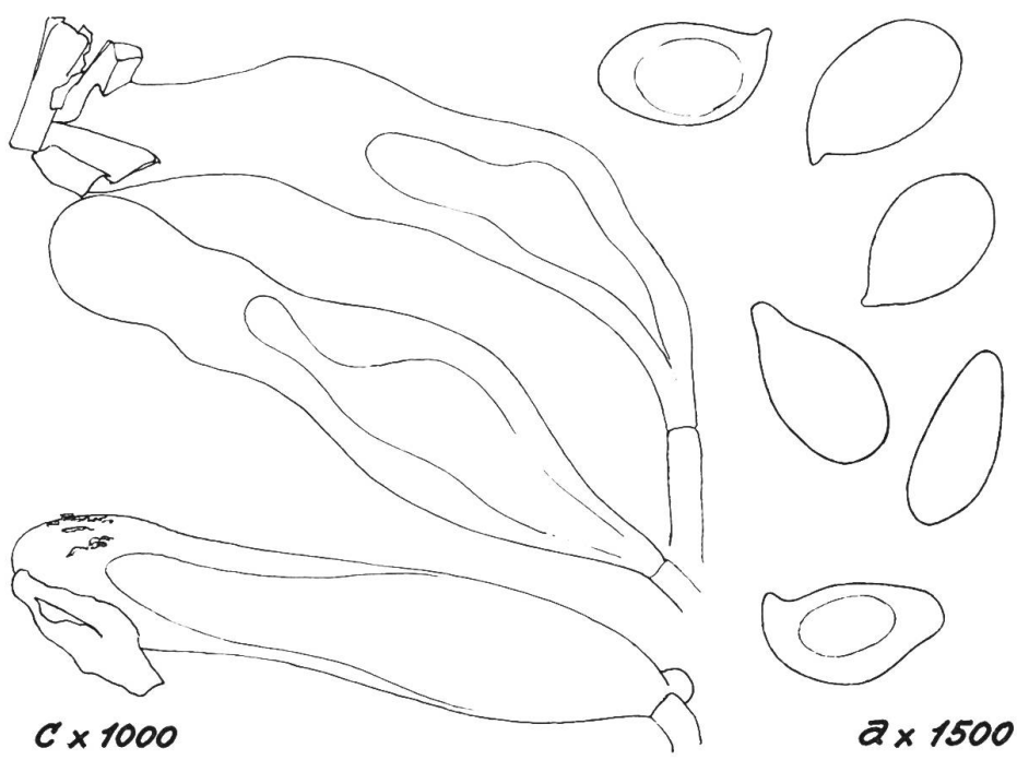
c x 1000