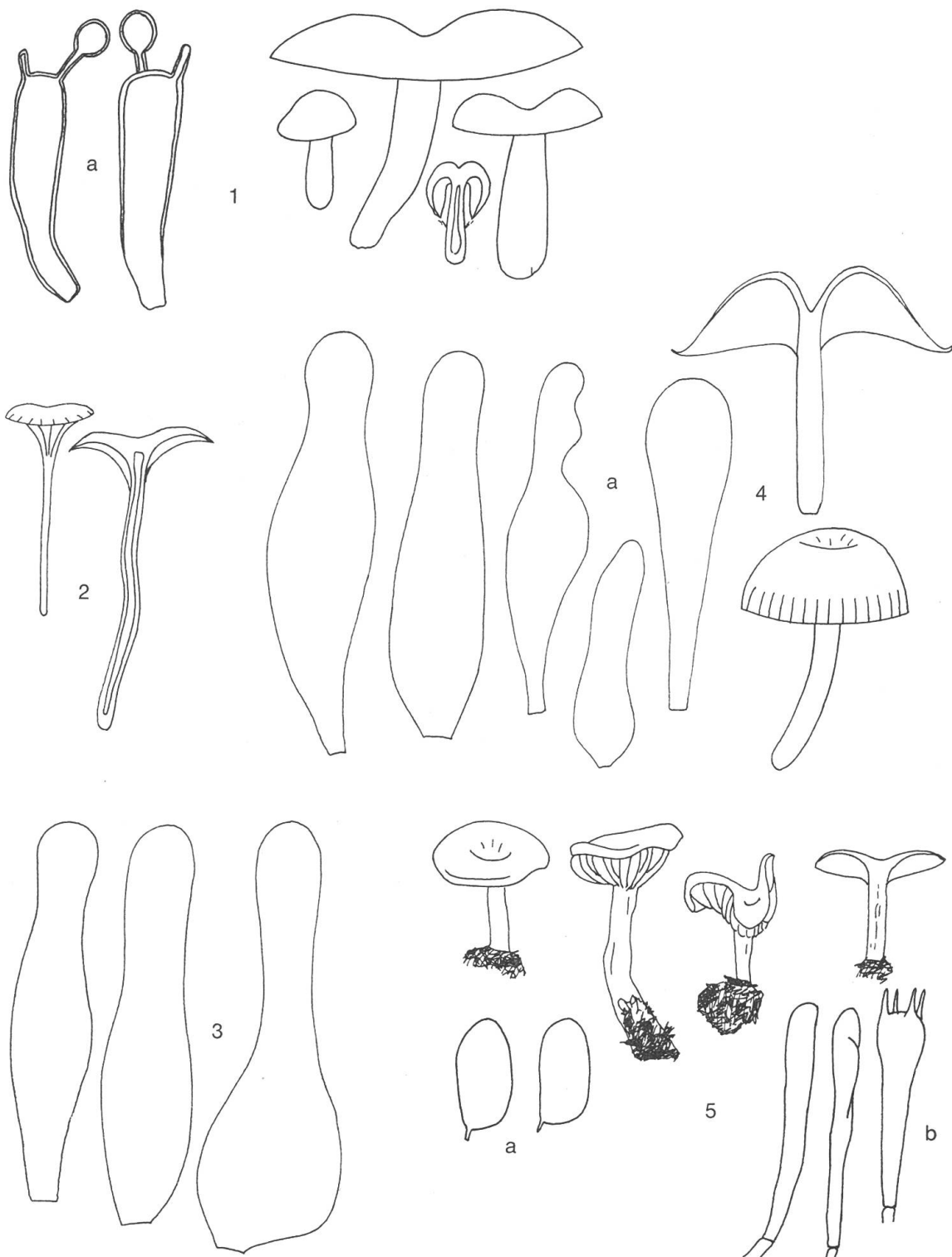
Fig. 1. Aeruginospora hiemalis , Fruchtkörper (nat. Gr.); a) Sklerobasidien (1000 : 1).