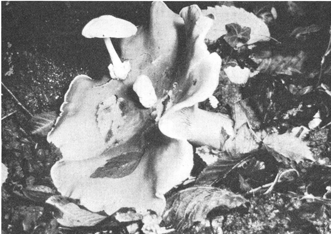
Im Hinblick auf ihre Funktion innerhalb des Naturganzen lassen sich die Pilze einteilen in Saprophyten, Parasiten und Symbionten. Unter den Parasiten gibt es – wie das Bild zeigt – gar solche, die bei ihren «Verwandten» schmarotzen (Parasitischer Scheidling auf Nebelgrauem Trichterling).

In was unterscheiden sich die beiden Pole? Im Bereich der Blüte stellen wir eine Tendenz zur Auflösung fest. In Blütenfarbe, Blütenduft und Pollen löst sich die Pflanze sozusagen in ihre Umwelt auf. Das Stoffwechselgeschehen dominiert am