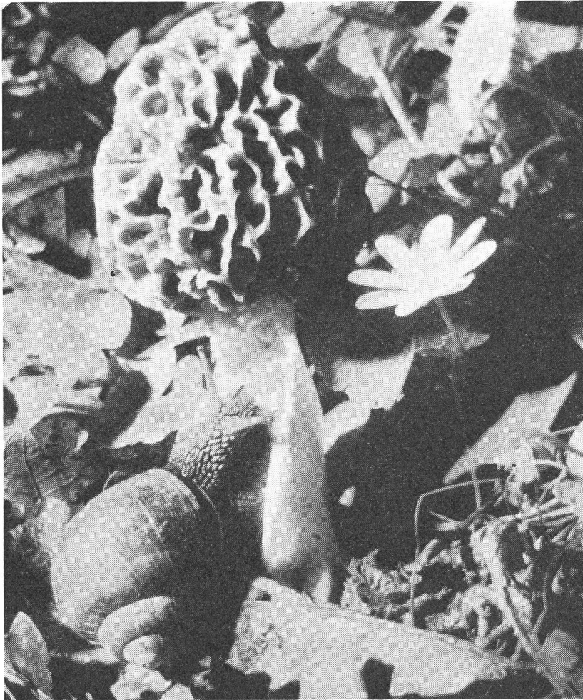
Pilz und Schnecke sind Glieder einer funktionellen Einheit, denn für viele Pilze ist nachgewiesen, dass ihre Sporen erst keimfähig werden, wenn sie den Verdauungsweg von Schnecken durchlaufen haben (Speisemorchel mit Weinbergschnecke).

Wer Pilze zu Speisezwecken sammeln will, ist in erster Linie verpflichtet, die giftigen kennenzulernen. Vor Pilzvergiftungen schützt nur eines: gründliche Kenntnis . Dies muss deshalb besonders betont werden, weil die volkstümlichen «Regeln» zur Verhütung von Pilzvergiftungen unglaublich zählebig sind. Der Aberglaube, ein beim Mitkochen schwarz anlaufender Silberlöffel würde Giftpilze anzeigen, ist nicht auszurotten. «Die wichtigste Regel zum Erkennen der Giftpilze lautet: es gibt keine Regel zum Erkennen der Giftpilze!», sagt Jahn treffend. Auch Pilze, die von Schnecken und anderem Kleingetier unbeschadet verzehrt werden, können für den Menschen giftig sein.