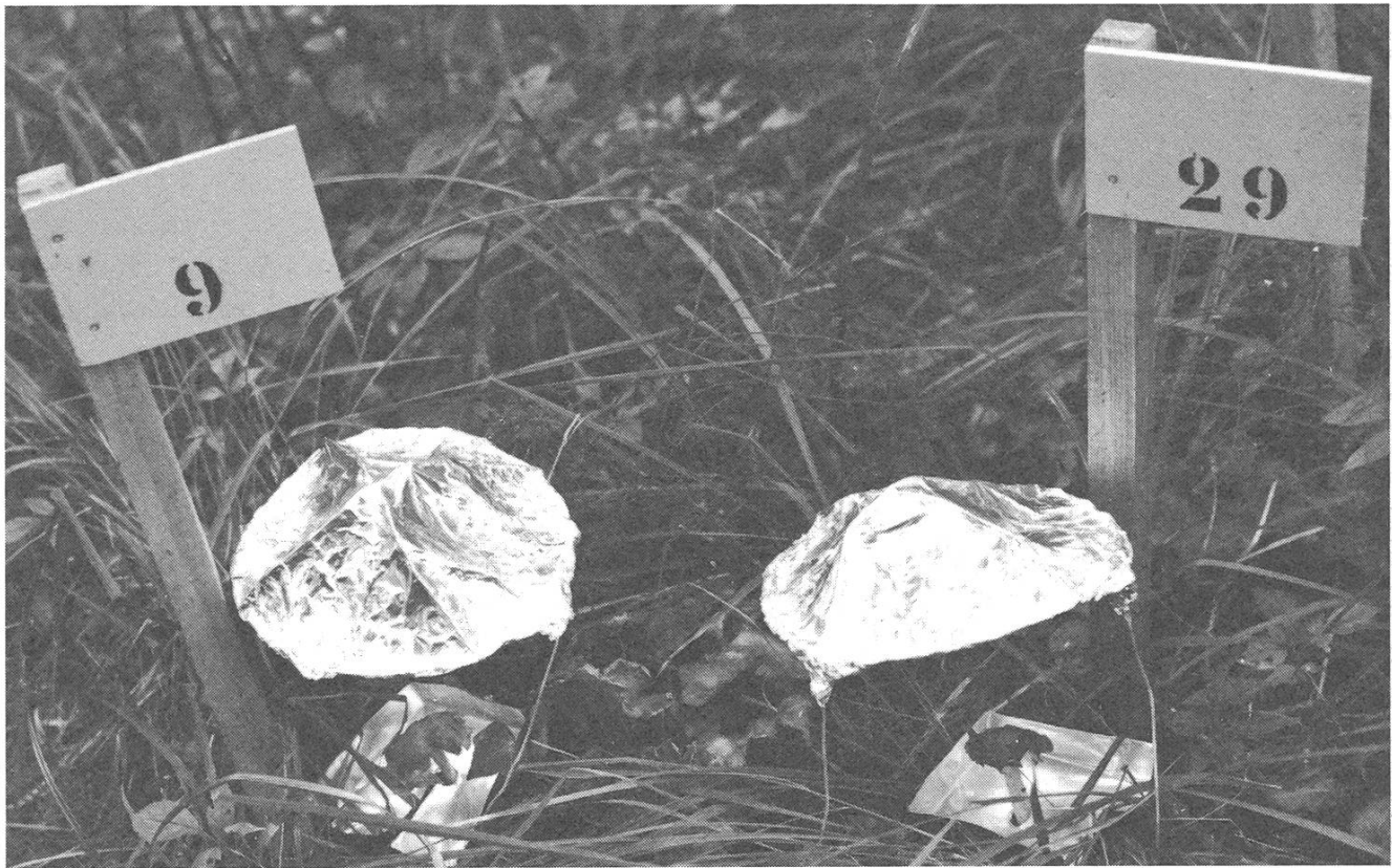
Fig. 2: Markierte Fruchtkörper mit Schutzdach und Sporenauffangschale Carpophores numérotés et appareillage pour recueillir les spores

Erscheinen gepflückt, so hat dieser Pilz erst einen relativ kleinen Prozentsatz seines gesamten Sporenpotentials abgeworfen. In dieser Zeitspanne hat aber ein kurzlebiger Pilz wie der Feldchampignon ( Agaricus campester ) mit einer maximalen Sporenabwurfdauer von 5 bis 6 Tagen schon praktisch sein ganzes Sporenpotential abgeworfen.