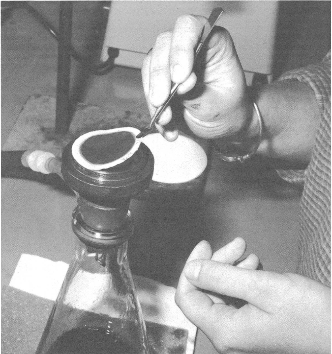
Fig. 3: Membranfilter mit ausfiltrierten Sporen Spores recueillies sur membrane filtrante

un amas de spores comportant plusieurs couches. Puis les filtres sont séchés pendant une heure à l'étuve à 40 °C, la glycérine de la solution permettant leur adhérence sur le filtre (Fig. 3).