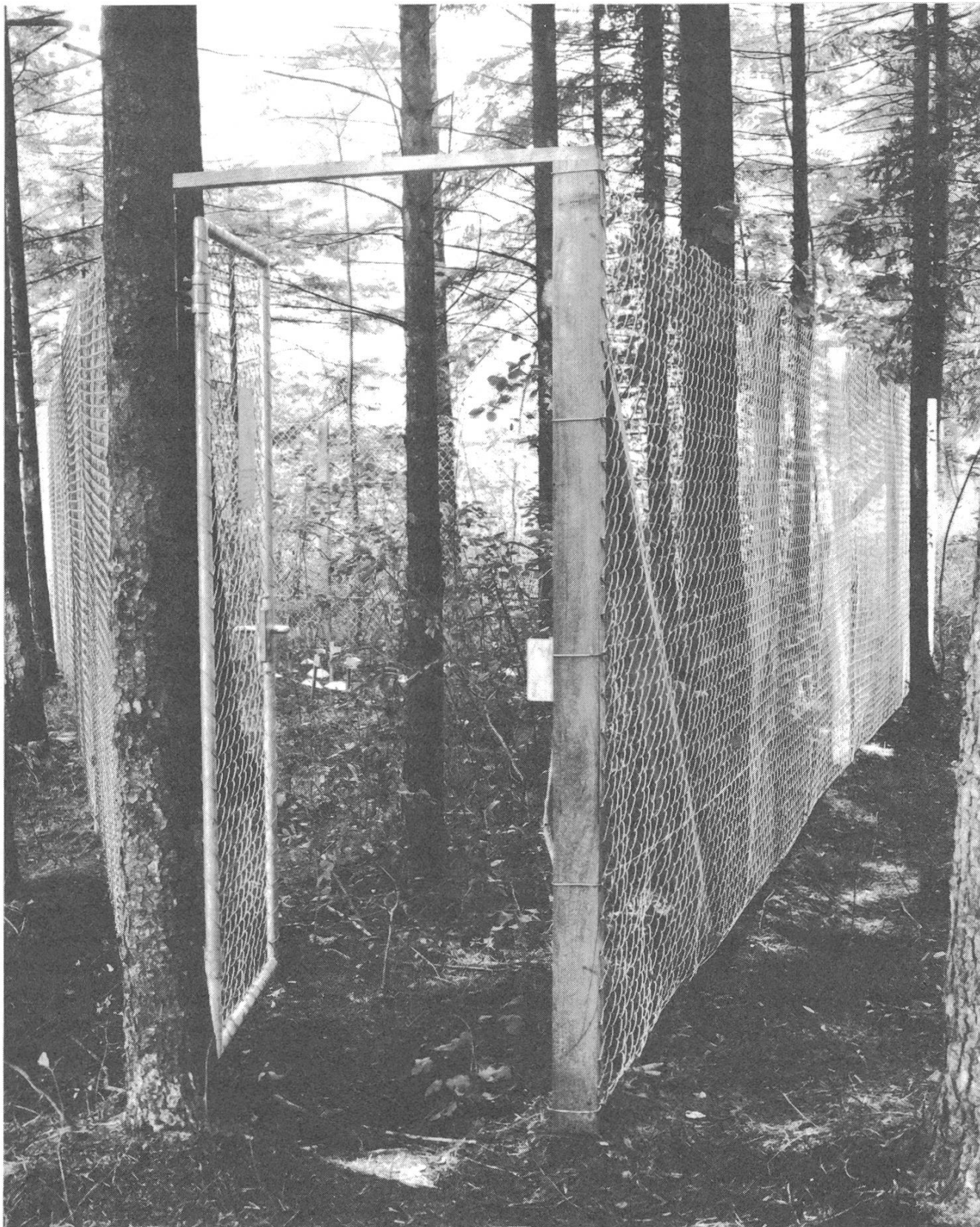
Fig. 1: Die Versuchsfläche im Pilzreservat «La Chanéaz» (FR) Le terrain d'observation dans la réserve de «La Chanéaz» (FR)