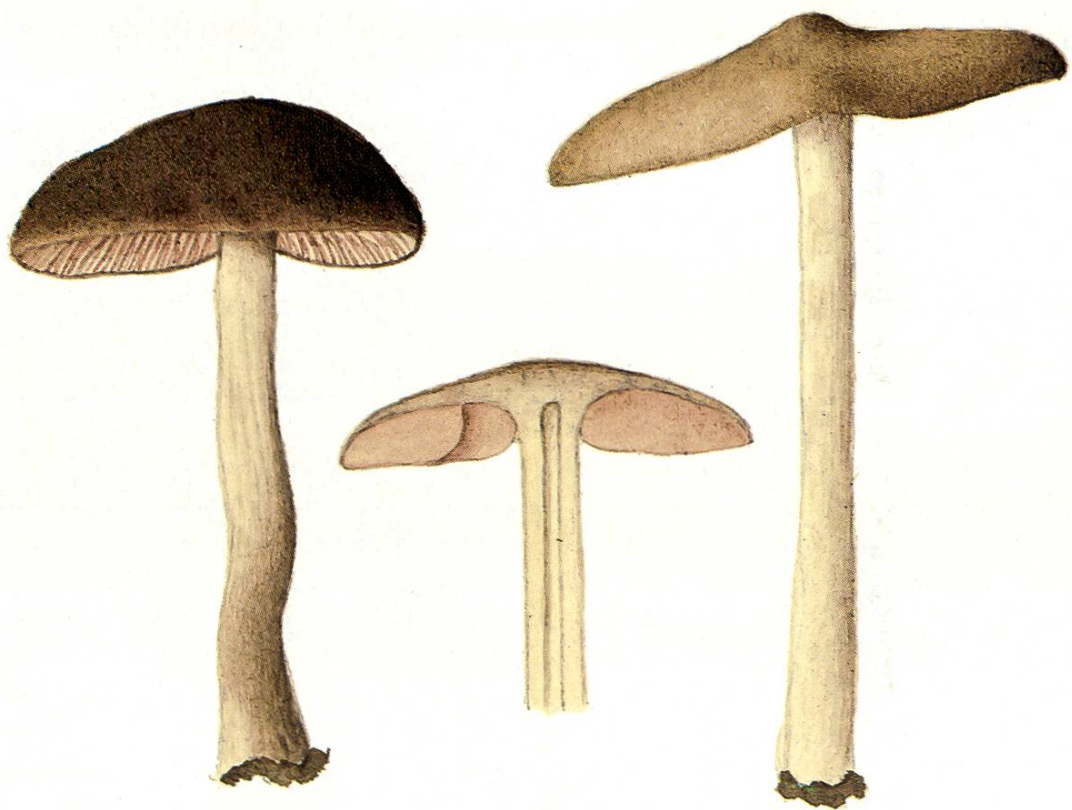
Entoloma sericatum (Britz.) Sacc.