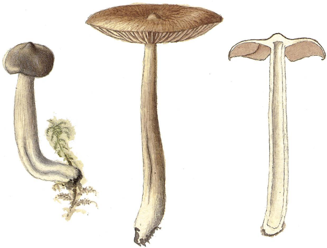
Entoloma helodes (Fr.) Kummer