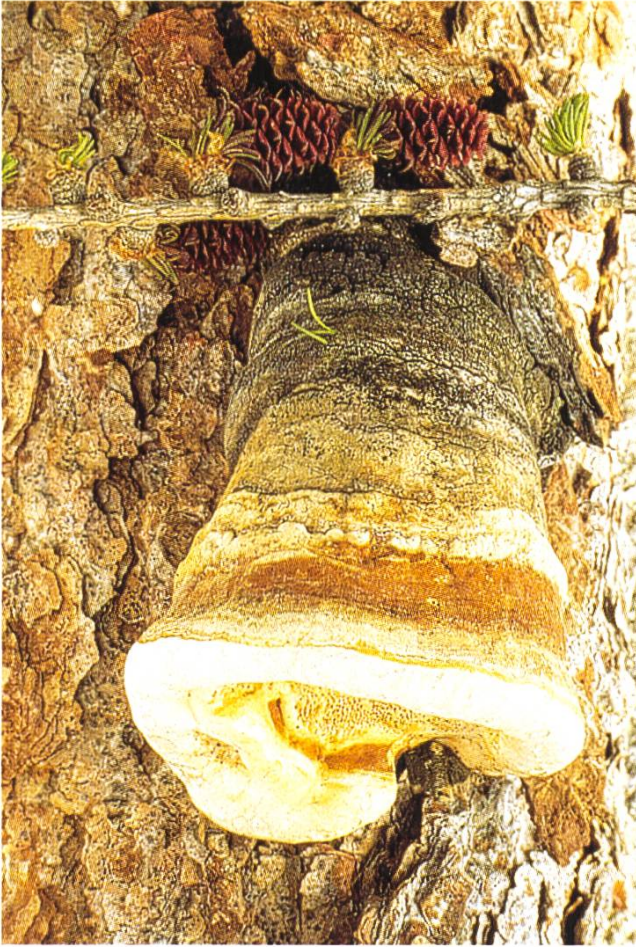
junger Fruchtkörper