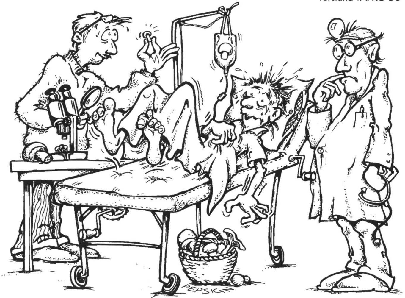
Illustration: Peter Dändliker, Küssnacht