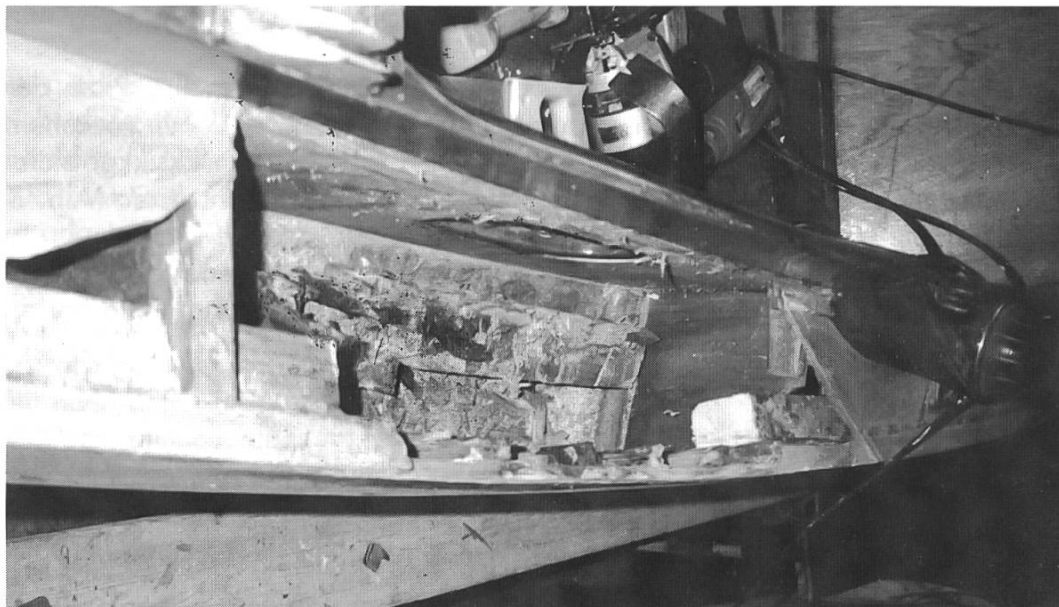
Phellinus contiguus (Fr.) Pat., au bordé tribord d'un voilier du Léman.