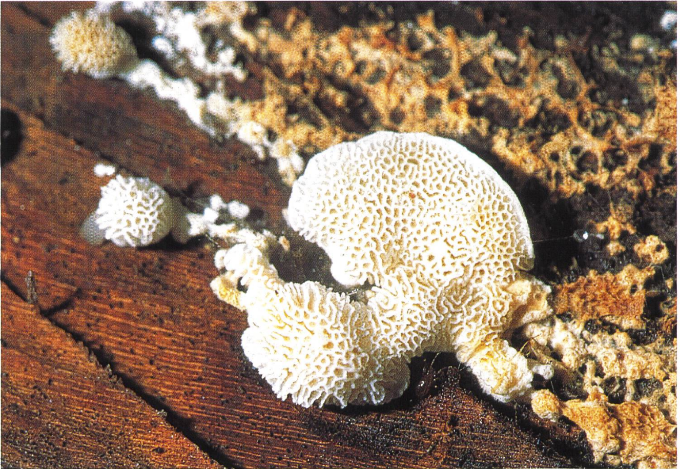
Oligoporus cerifluus , von unten betrachtet.