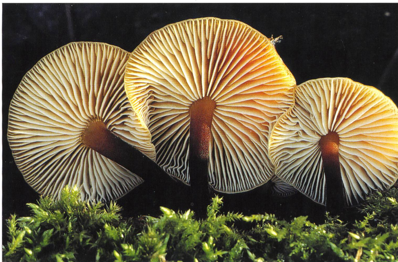
Samtfussrübling, Flammulina velutipes , collybie à pied velouté