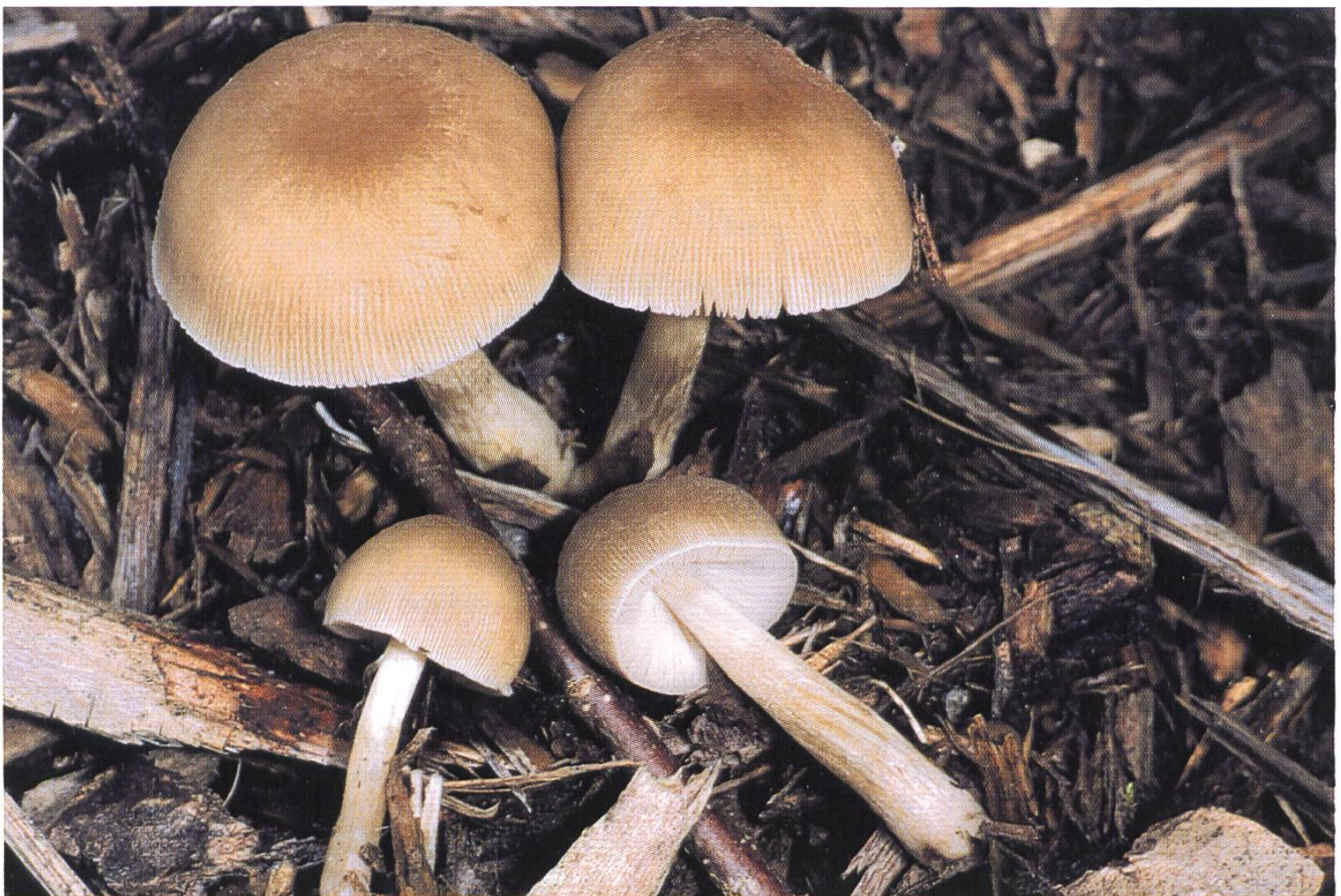
Pluteus depauperatus : auf Häcksel / sur copeaux ligneux