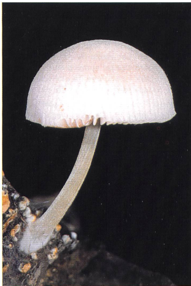
Pluteus depauperatus :

weitere Exemplare auf Laubholz / autres exemplaires sur bois de feuillus