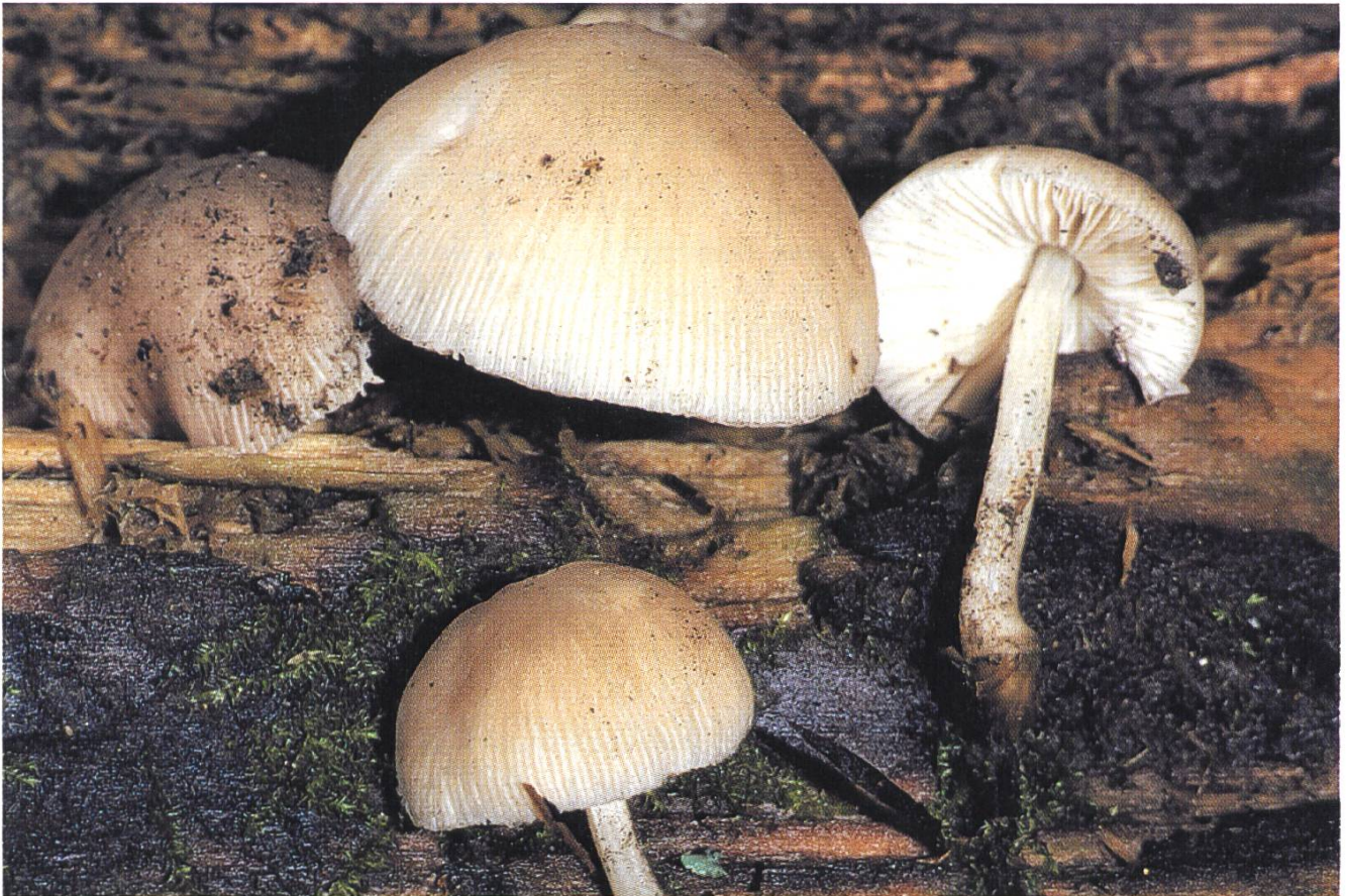
Pluteus depauperatus auf Laubholz / sur bois de feuillus