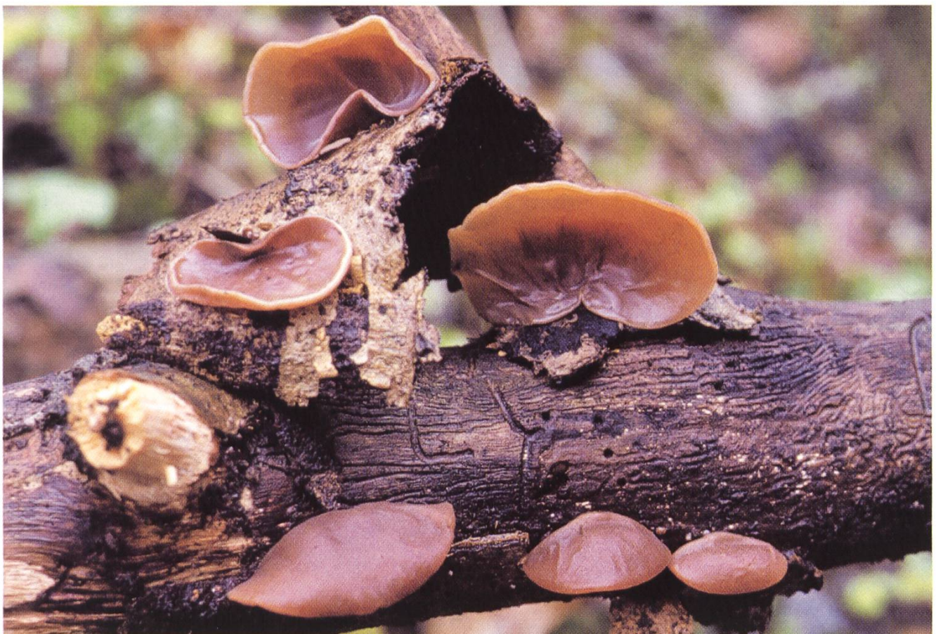
Auricularia auricula-judae , Judasohr.