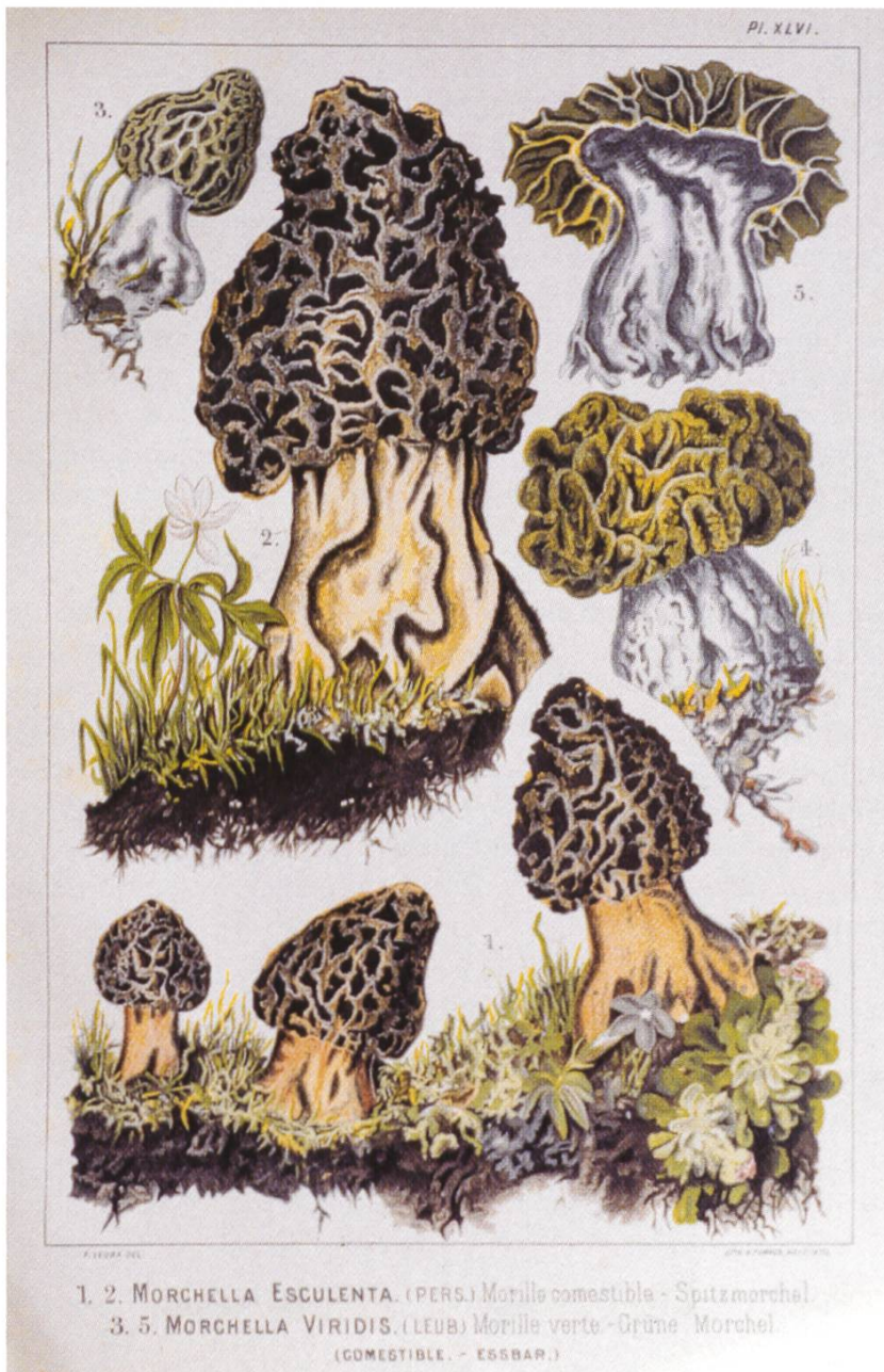
Fig. 3: Planche du livre montrant les morilles

édition brochée sans planches en couleurs, on peut l'obtenir à bas prix.