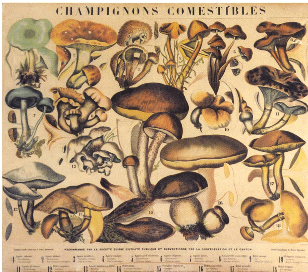
Fig. 4: Planche murale (Chromolithographie) des principaux champignons comestibles. Editée avec subvention de la Confédération et du Canton

Voici la morille! En est-il un seul d'entre vous chez lequel ce nom n'évoque des souvenirs délicieux de cueillettes heureuses, de courses enchantées, d'odeurs de sapins, de nuages de rosées d'aurore, d'appels de coucous et de tout le cortège enivrant du printemps? Quel est celui dont le cœur ne tressaille d'aise au souvenir de la vue d'une de ces belles morilles que nous avons contemplées un instant avant d'oser y porter une main sacrilège? Qui ne connaît la morille et qui la connaît sans l' aimer ? En effet, de tous les champignons, aucun ne passionne davantage l'amateur, aucun n'est recherché avec autant de plaisir et d'acharnement, aucun n'intéresse des catégories des gens aussi diverses. Depuis le négociant affairé au rentier inactif, de l'artiste amateur à l'ouvrier sédentaire, tous aiment à la trouver. Le vrai morilleur se livre sans arrière-