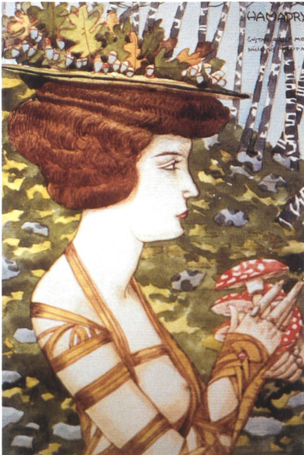
Gustav Adolf Mossa

Il est bien connu que le mouvement artistique qu'on appelle Art Nouveau est apparu en Europe vers l'année 1900. Selon les pays, il a pris différents noms: Jugendstil en Allemagne, Modern Style en Angleterre, Stile Liberty en Italie, Modernismo en Espagne et Tiffany Style aux Etats-Unis. L'Art Nouveau peut être considéré comme une réaction des artistes contre le réalisme géométrique de l'ère industrielle. Parmi les grands peintres qui se sont exprimés dans ce style,