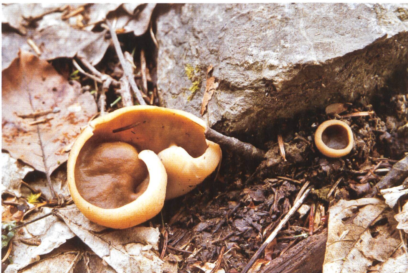
Gyromitra geogenia am Fundort (Kollektion U.R. 550-561 / April 2004).