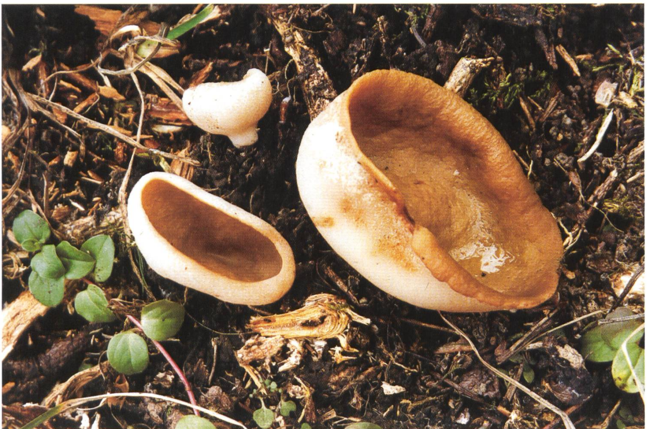
Gyromitra geogenia am Fundort (Mai 1994, Fruchtkörper steril / fructifications stériles)