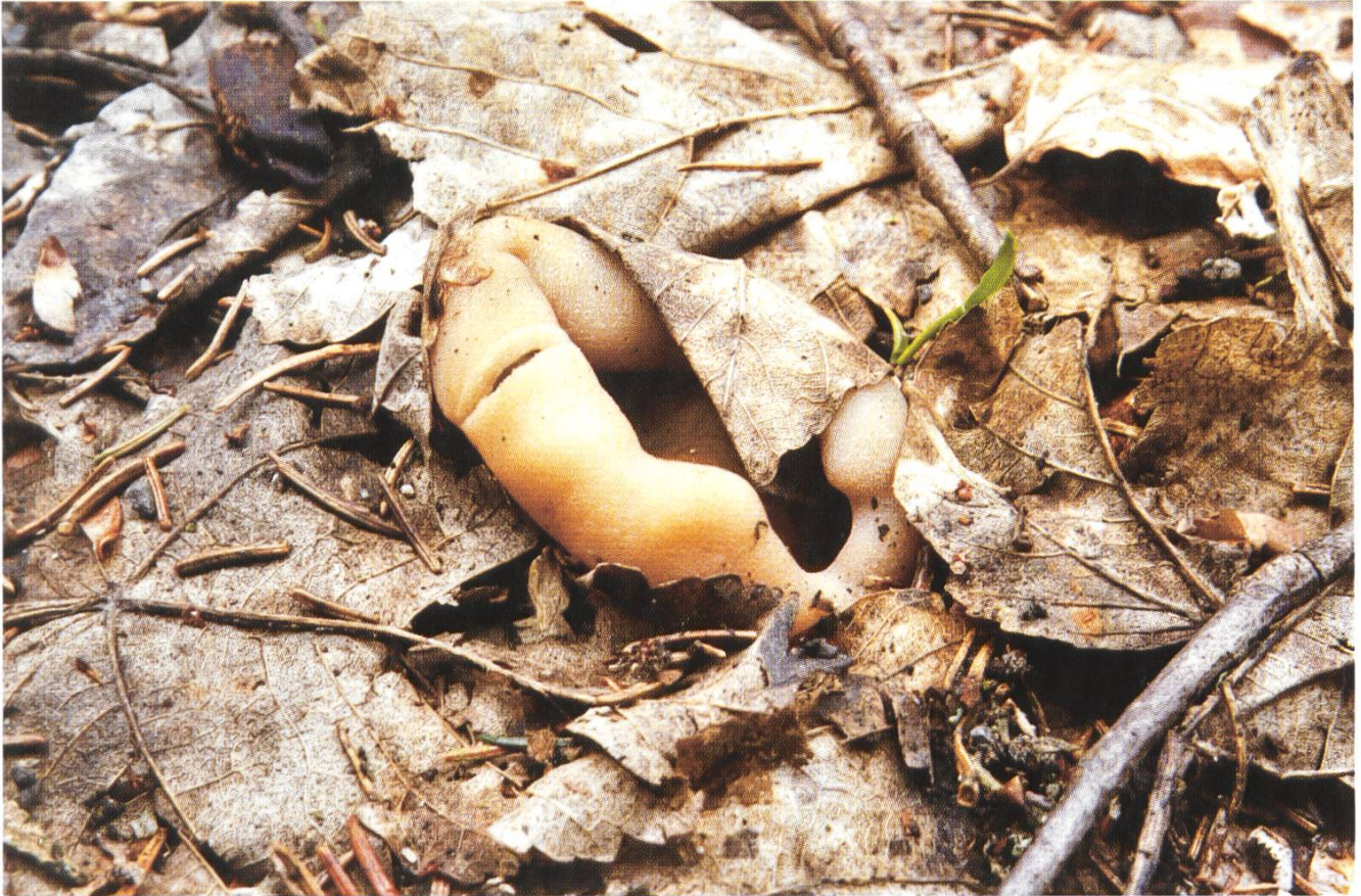
Gyromitra geogenia am Fundort (Kollektion U.R. 550-561 / April 2004).