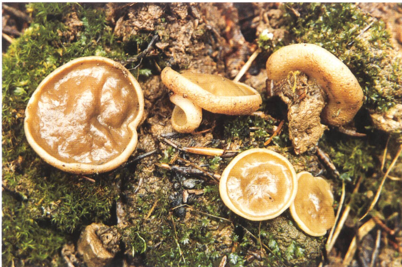
Gyromitra geogenia am Fundort (Kollektion U.R. 50-96 / März 1995).