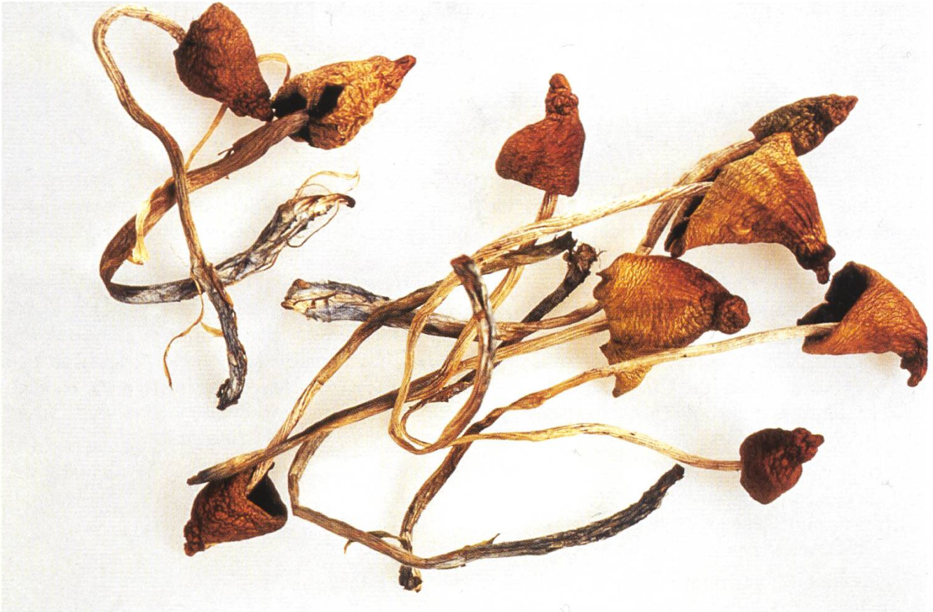
Psilocybe semilanceata , Spitzkegeliger Kahlkopf

Bei diesem einen Beispiel soll es bleiben. Es hat sich jedenfalls gelohnt, sich einmal Gedanken über die geheimnisvolle Welt des Mikrokosmos gemacht zu haben.