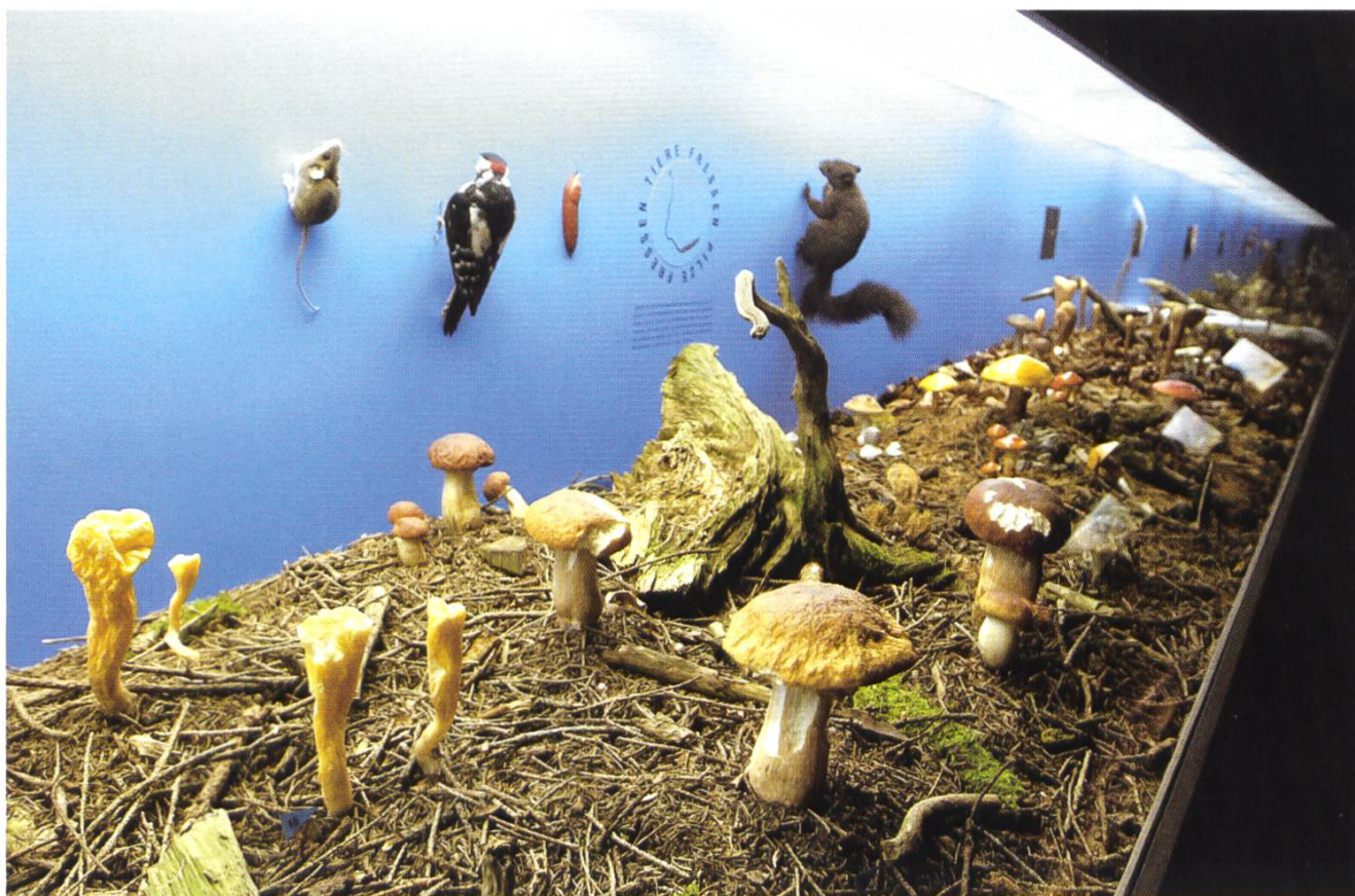
Pilze (Kunststoffmodelle) in ihrem natürlichen Lebensraum. Zu sehen noch bis Ende 2005 im Naturhistorischen Museum Bern.

Informationen zum Naturhistorischen Museum in Bern finden sich unter: http://www.nmbe.ch