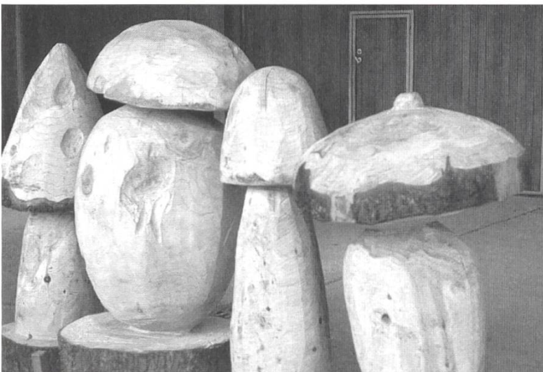
Fig. 3: Micosculture lignee degli apprendisti selvicoltori ticinesi

E allora provate con le gite micologiche didattiche accompagnate, a gruppetti non troppo numerosi, sostate nelle apposite aree di svago forestale o presso qualche trattoria rurale ad esaminare quanto avrete raccolto. Più FUNGI WATCHING e meno FUNGI SHOPPING – la Micologia, l'Ecologia e soprattutto la Natura silvestre ve ne saranno molto grati.