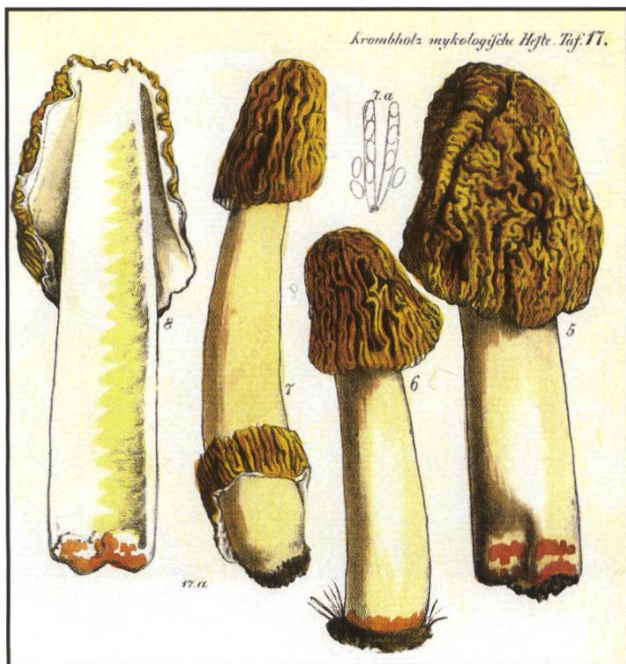
Morchella bohemica , Krombholtz Taf. 17

Wir nahmen zunächst an, es handle sich um einen Irrgast unter einem Lot von Morchella conica . Doch zeigten eine zweite und eine dritte Pastete dasselbe Bild mit den Riesensporen, die immer zu zweien hintereinander aufgereiht waren.