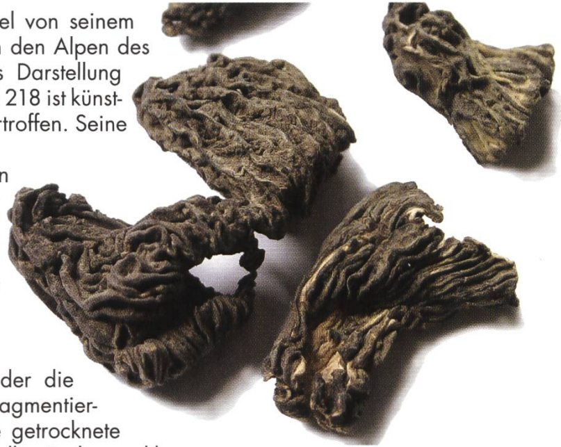
Getrocknete Exemplare von Ptychoverpa bohemica aus unserm Lot

Wir erhielten vom Produzenten, der die Grossverteiler belieferte, sowohl fragmentierte Nasskonserven als auch einige getrocknete Fruchtkörper zur Untersuchung. In allen Proben, inklusive in zwei Pasteten, fanden wir nur Asci mit den erwähnten Riesensporen. Makroskopisch sind die Böhmisches Morcheln leicht zu erkennen an ihren freien Stielen und glockenförmig aufgesetzten Hüten und vor allem an dem längsfaltigen, dicht gedrängten, welligen Hymenium, so wie es auch Bächler (2) an einem zweisporigen Fund aus dem Bedrettal beschreibt.