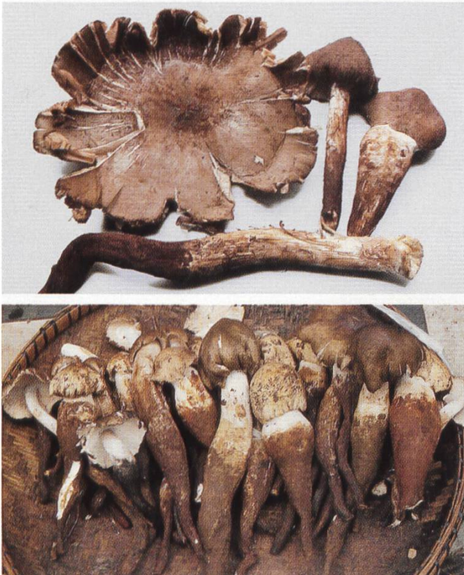
Fig. 5 Termitomyces eurrhizus

ne permet souvent qu'une détermination du genre et met en évidence des contaminants. Les champignons utilisés ne sont parfois pas encore matures et leur détermination n'est guère possible. Ainsi, on a analysé dans un lot de cèpes congelés des spécimens hauts de 2 cm au plus, qui n'avaient pas encore formé leurs spores.