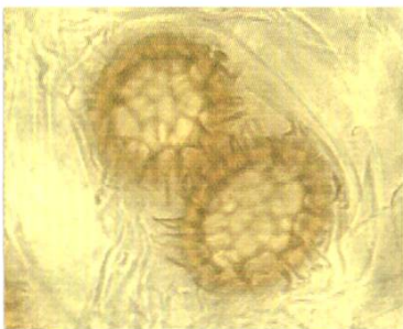
Abb./fig. 3 Tuber pseudoexcavatum