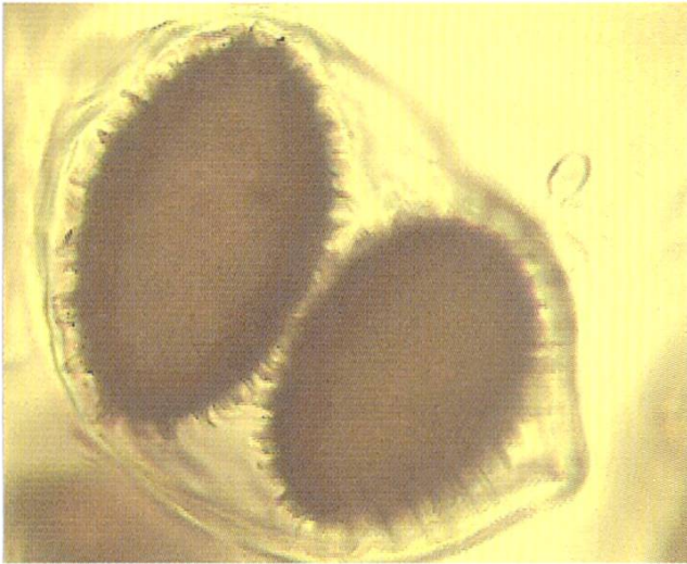
Abb./fig. 1 Tuber melanosporum