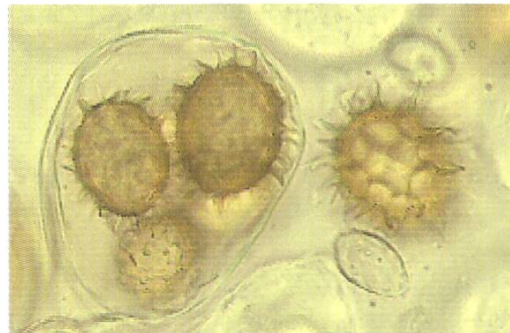
Abb./fig. 4 Tuber pseudohimalayense