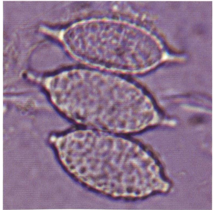
Sporen in H 2 O | Spores dans H 2 O