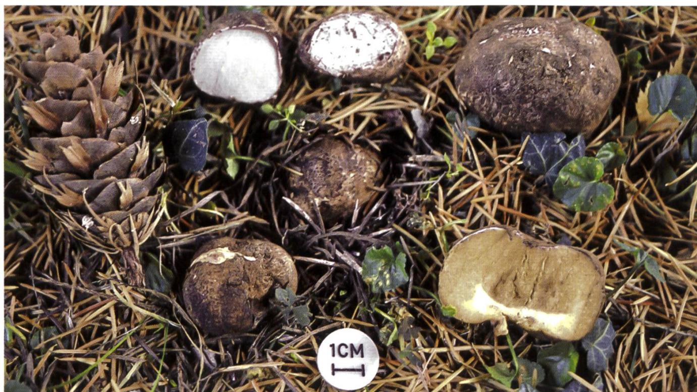
Rhizopogon villosulus nel habitat

MONTECCHI A. & M. SARASINI 2000. Funghi ipogei d'Europa, p. 422–425, ed. AMB, Trento.