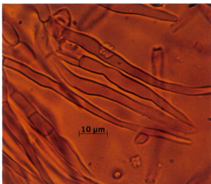
R. amoenicolor Haare der HDS | Poils piléiques

R. amoenicolor wird sehr oft mit R. amoena verwechselt. Diese ist aber deutlich kleiner und schwächer, nie so massiv, der Hutrand ist meistens auch alt etwas eingerollt. Violette Formen von R. violeipes sind ebenfalls nicht auszuschließen, weichen aber durch ihren mehr kugeligen Habitus und die auffällig tönchenförmig unterteilten Huthaare ab. Oberflächlich kann R. amoenicolor natürlich auch mit Arten der Sektion Sardoninae Singer um R. queletii (Stachelbeertäubling) oder R. torulosa Bresadola (Gedrungener Täubling) verwechselt werden, diese sind jedoch ausnahmslos scharf.