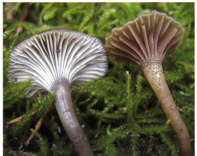
Specie a confronto – a sinistra C. atrovelutina a destra C. atropuncta | Vergleich – links C. atrovelutina , rechts C. atropuncta .

Camarophylloopsis atrovelutina ist eine sehr seltene Art, wie die vorliegenden Funde als Schweizer Erstfunde beweisen. Diese Funde in Ettingen (Kanton Basel-Landschaft), in einem hügeligen, feucht-nassen Waldgebiet auf kalkreichem Boden belegen die Vorliebe der Gattung Camarophylloopsis für solche Habitats. Es wurden auch andere Arten aus der gleichen Gattung gefunden: Camarophylloopsis micacea