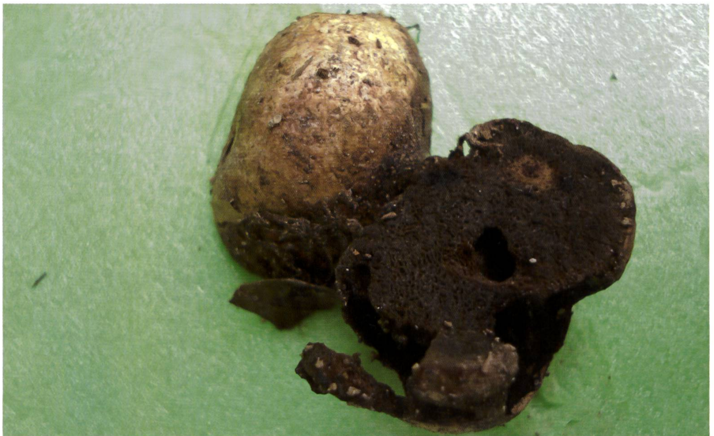
Rhizopogon vinicolor : Fruchtkörper | Fructifications