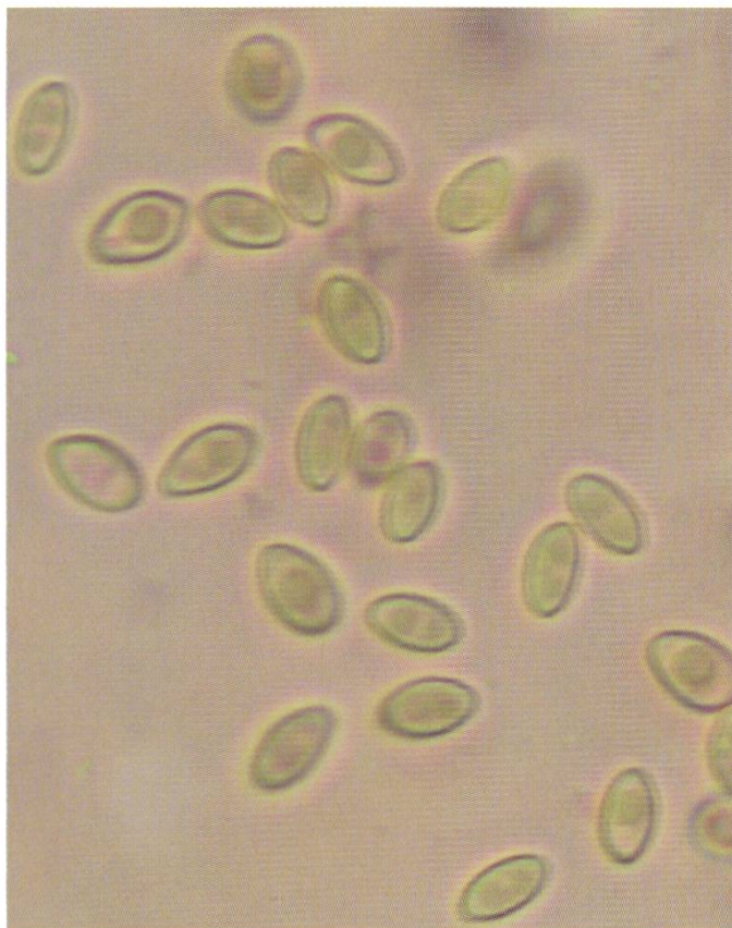
Rh. vinicolor : Sporen | Spores

Basides > Cylindriques, 25–38 × 5–6,5 µm, basidiosoles clavées, aucune boucle observée.