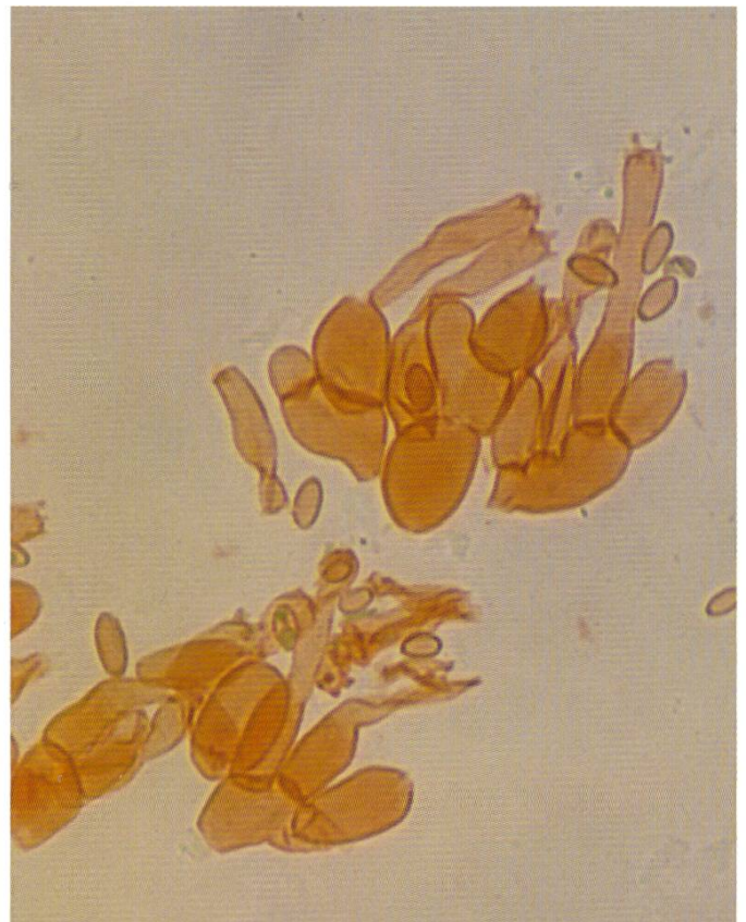
Rh. pannosus : Basidien | Basides