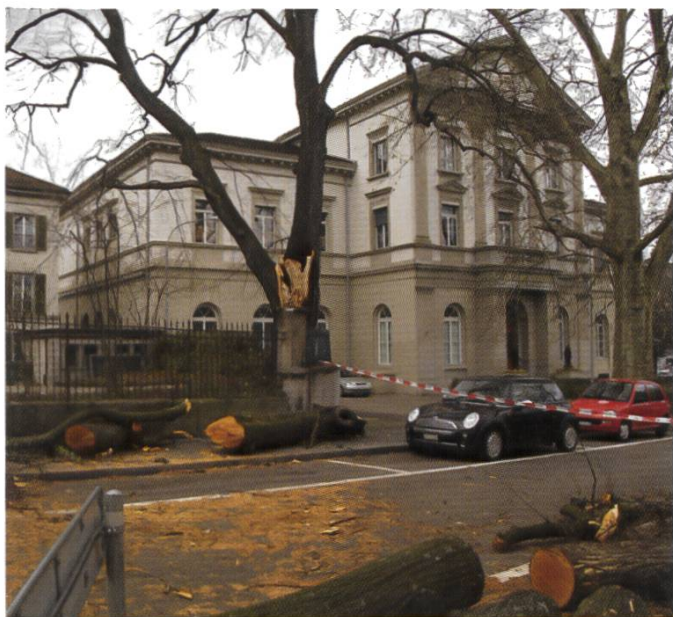
Die Linde beim Zürcher Obergericht 2008 nach dem Sturm «Emma»

linden genannt – wurden bis ins 19. Jahrhundert. Gerichtsverhandlungen abgehalten. Da die Linde als weibliches Wesen gilt, soll deshalb das Urteil unter der Linde meist «lind», also milde ausgefallen sein. Welche Urteile unter der altehrwürdigen Linde beim Zürcher Obergericht am «Lindenegg» gefällt wurden, weiss aber niemand so genau.