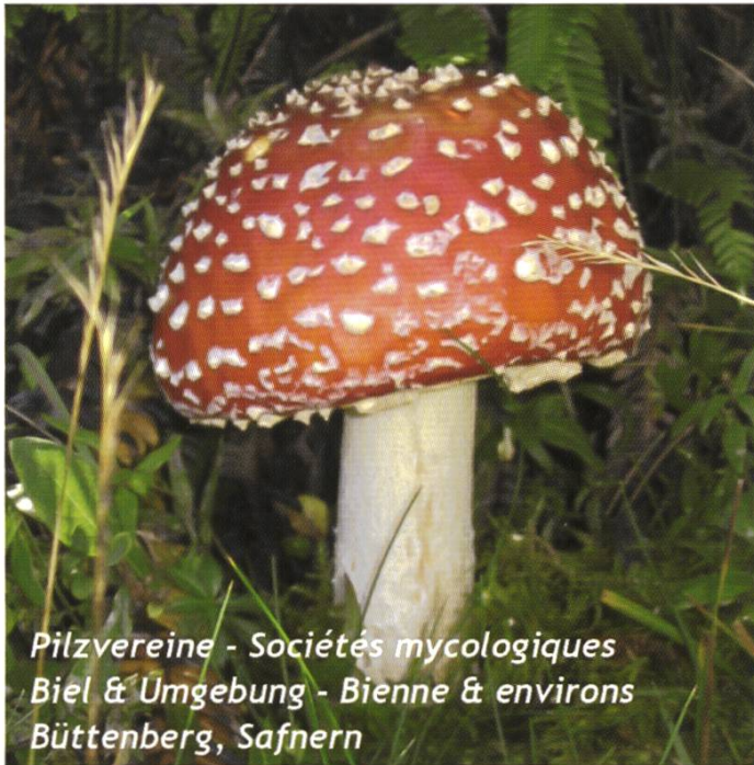
Pilzvereine - Sociétés mycologiques Biel & Umgebung - Bienne & environs Büttenberg, Safnern