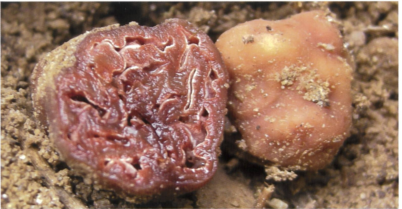
Fruchtkörper mit reifen Sporen | Fructifications avec des spores matures