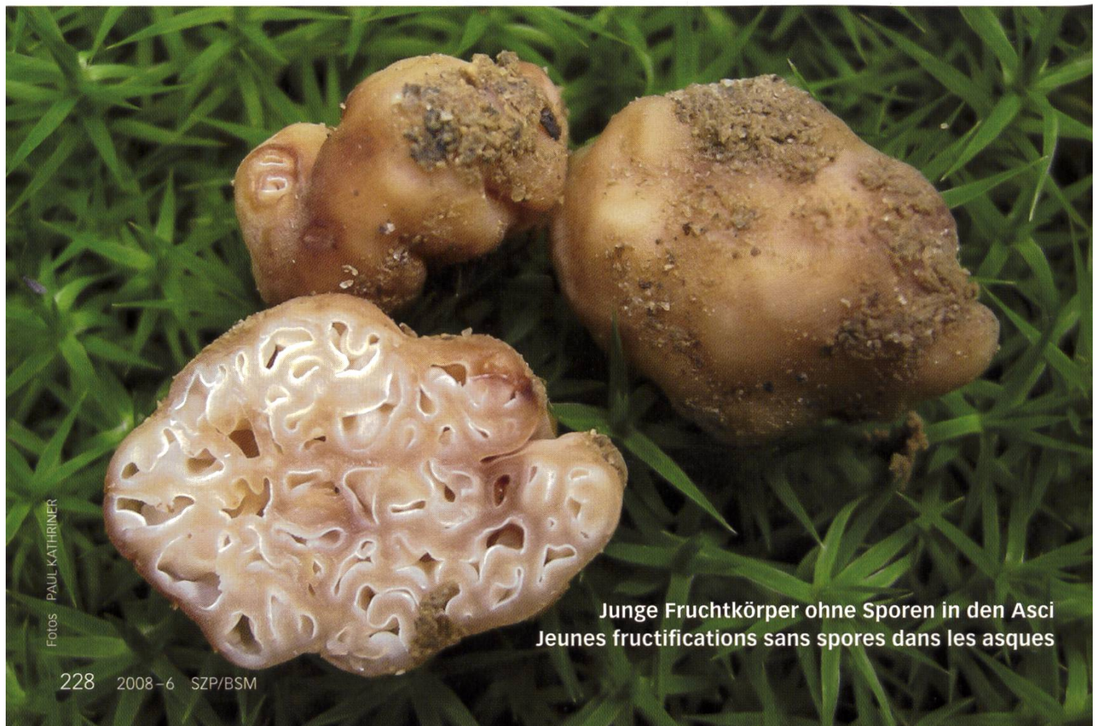
Junge Fruchtkörper ohne Sporen in den Asci Jeunes fructifications sans spores dans les asques

Sporen > 20–30 µm ohne Ornamente, reif rötlichbraun, rundlich, grob warzig mit Placken und Lappen.