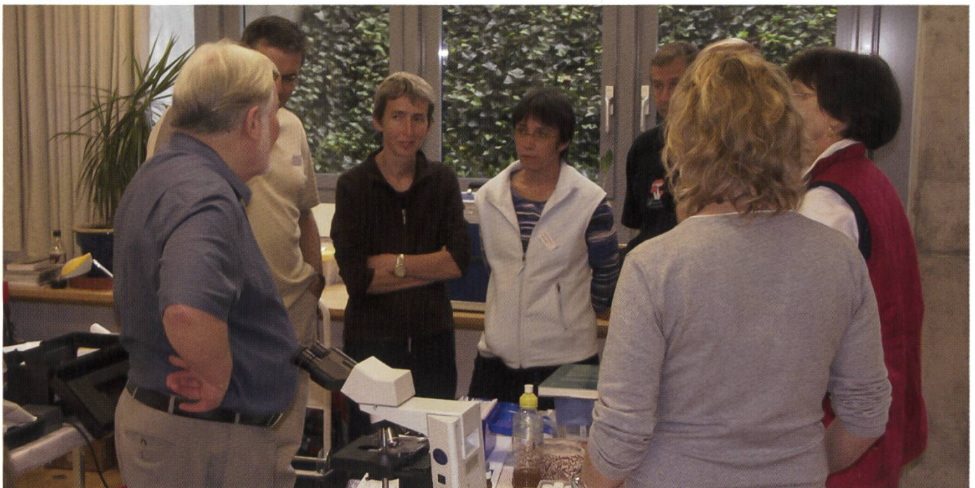
Teilnehmende des Spitaldiagnostikkurses 2008 in Landquart