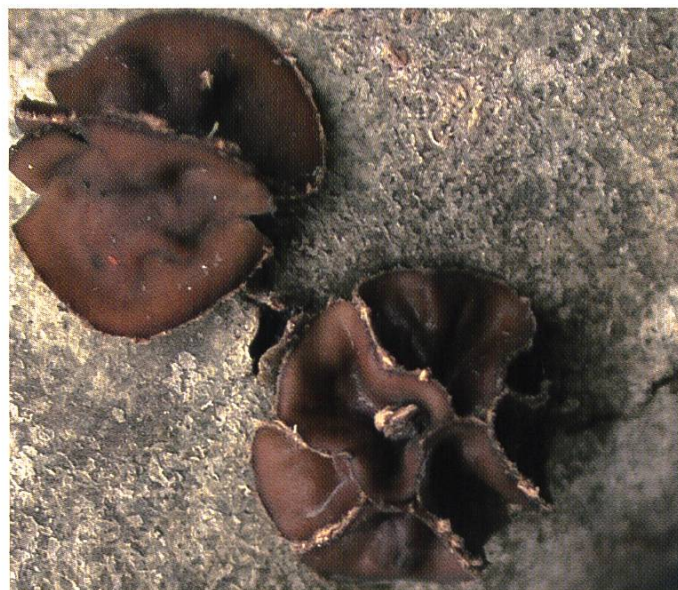
Schwarzbrauner Büschelbecherling ( Encoelia fascicularis )