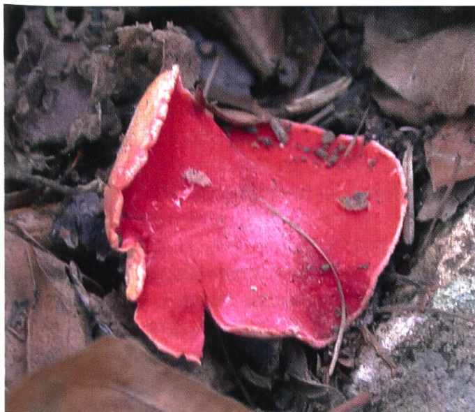
Zinnoberroter Prachtsbecherling ( Sarcoscypha coccinea )

Die nationale Pilzdatenbank SwissFungi enthält für jeden Pilzfund Angaben zum Fundort sowie zum Beobachtungsdatum. Somit erlaubt sie auch phänologische Auswertungen für Pilzfunde mit genauen Angaben (d.h. +/- 1 Tag) zum Funddatum. Eine erste Auswertung zeigt ein erstaunliches Resultat: selbst aus dem datenärmsten Monat, dem Februar, sind noch über 350 Pilzarten gemeldet und im reichsten Monat, im Spetember, sind gesamtschweizerisch über 2800 Pilzarten beobachtet worden. Pilze können somit wirklich ganzjährig beobachtet werden,