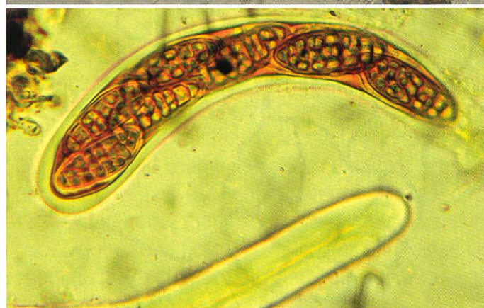
Hysterographium fraxini: Aschi | Asci

Abbastanza raro. Si tratta del primo ritrovamento a sud delle Alpi, poco diffuso anche al nord. Pochi i ritrovamenti segnalati durante gli ultimi 20 anni. Forse data la piccolezza e il colore passa inosservato e il frassino non è così ampiamente diffuso in tutte le zone del Ticino e della Svizzera.