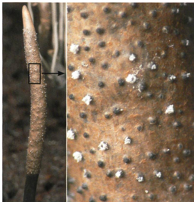
Xylaria escharoidea : Fructifications fertiles | Fertile Fruchtkörper