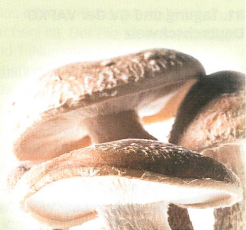
Shiitake ( Lentinula Edodes )