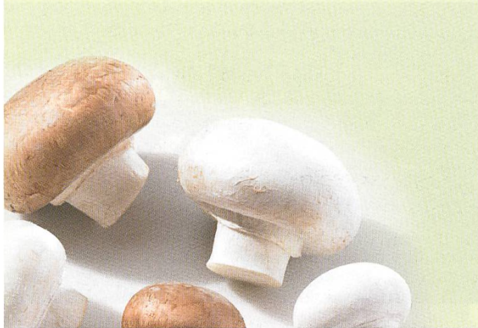
Champignon de Paris ( Agaricus bisporus )