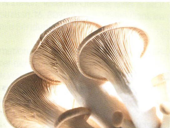
Kräuterseitling ( Pleurotus eryngii )