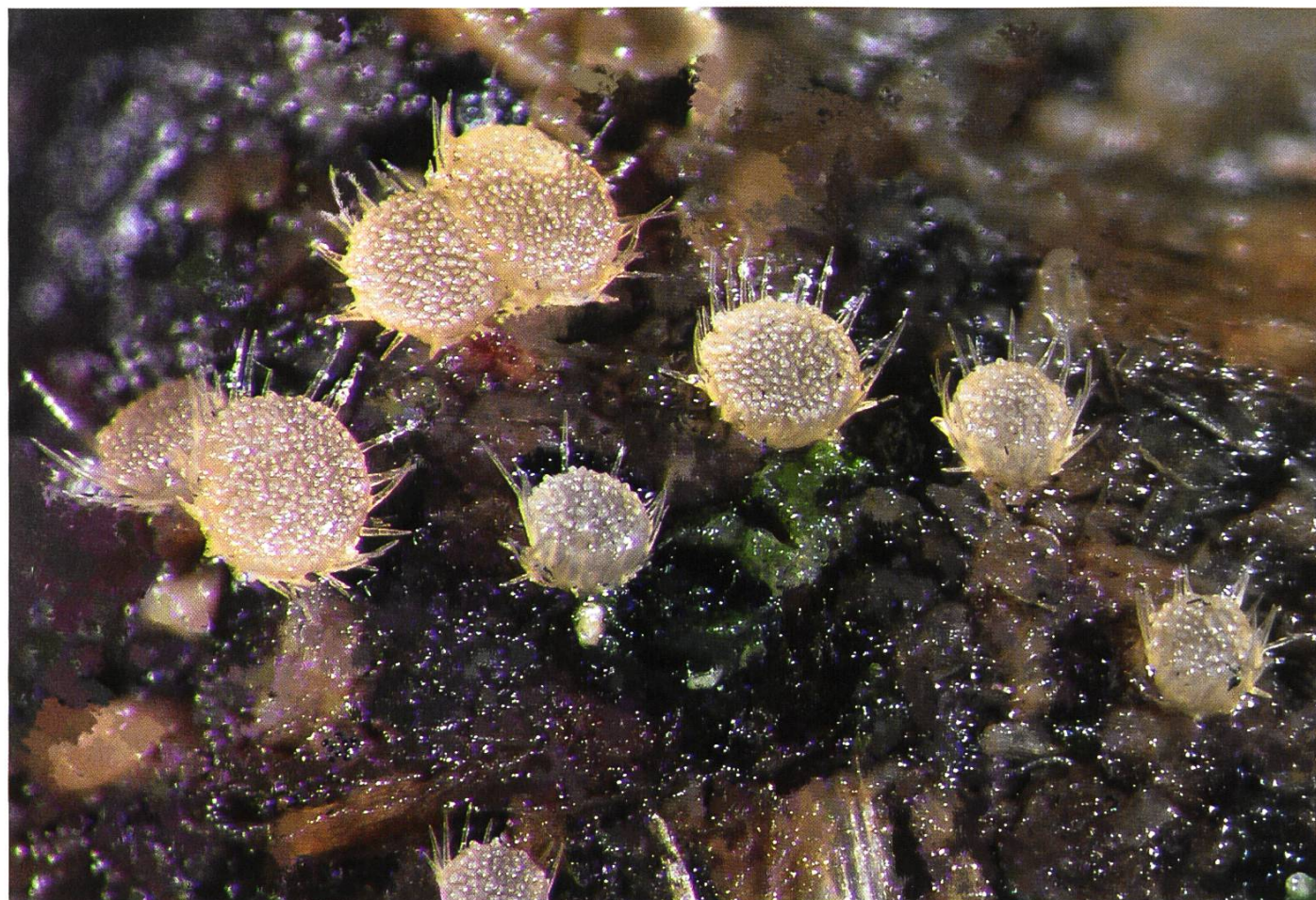
Lasiobolus macrotrichus Ascocarpes | Fruchtkörper

La description a été effectuée à partir de champignons vivants. Les montages des coupes et d'autres éléments de la microscopie ont été réalisés dans H 2 O distillée, le bleu coton lactique, le rouge Congo SDS et le réactif de Melzer (contrôle de l'amyloïdie des asques). Les ascospores ont été mesurées dans le rouge Congo SDS. Les valeurs statistiques ont été obtenues à partir d'une popu-