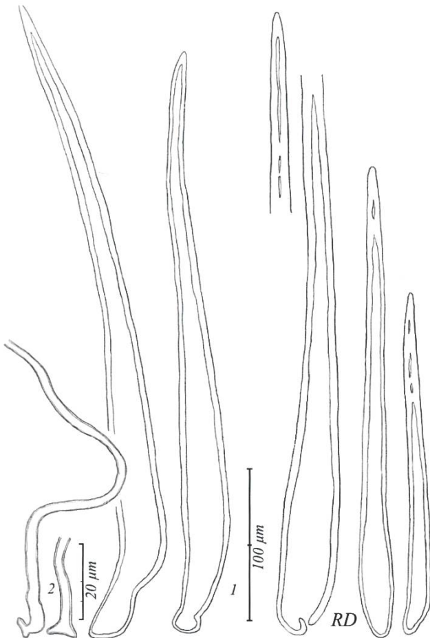
Lasiobolus macrotrichus 1. Poils | Haare. 2. Hyphes d'ancrage | Ankerhyphen.

Seit mehreren Jahren sammle ich auf Rehlosung einen kleinen Diskomyzeten aus der Gattung Lasiobolus . Obwohl die artspezifischen Unterschiede (besonders die Sporen) mich schnell zu L. macrotrichus geführt haben, habe ich mich an der Tatsache gestossen, dass diese Art (wie der Name schon sagt) lange Haare haben sollte. Diese sollten mindestens 600 µm lang sein! Erst in einigen Exemplaren der letzten Aufsammlung konnte ich diese nachweisen. Nach der Durchsicht neuerer Literatur bin ich zum Schluss gekommen, dass die Länge der Haare nicht unbedingt ein gutes Merkmal ist, um diese Art zu bestimmen.