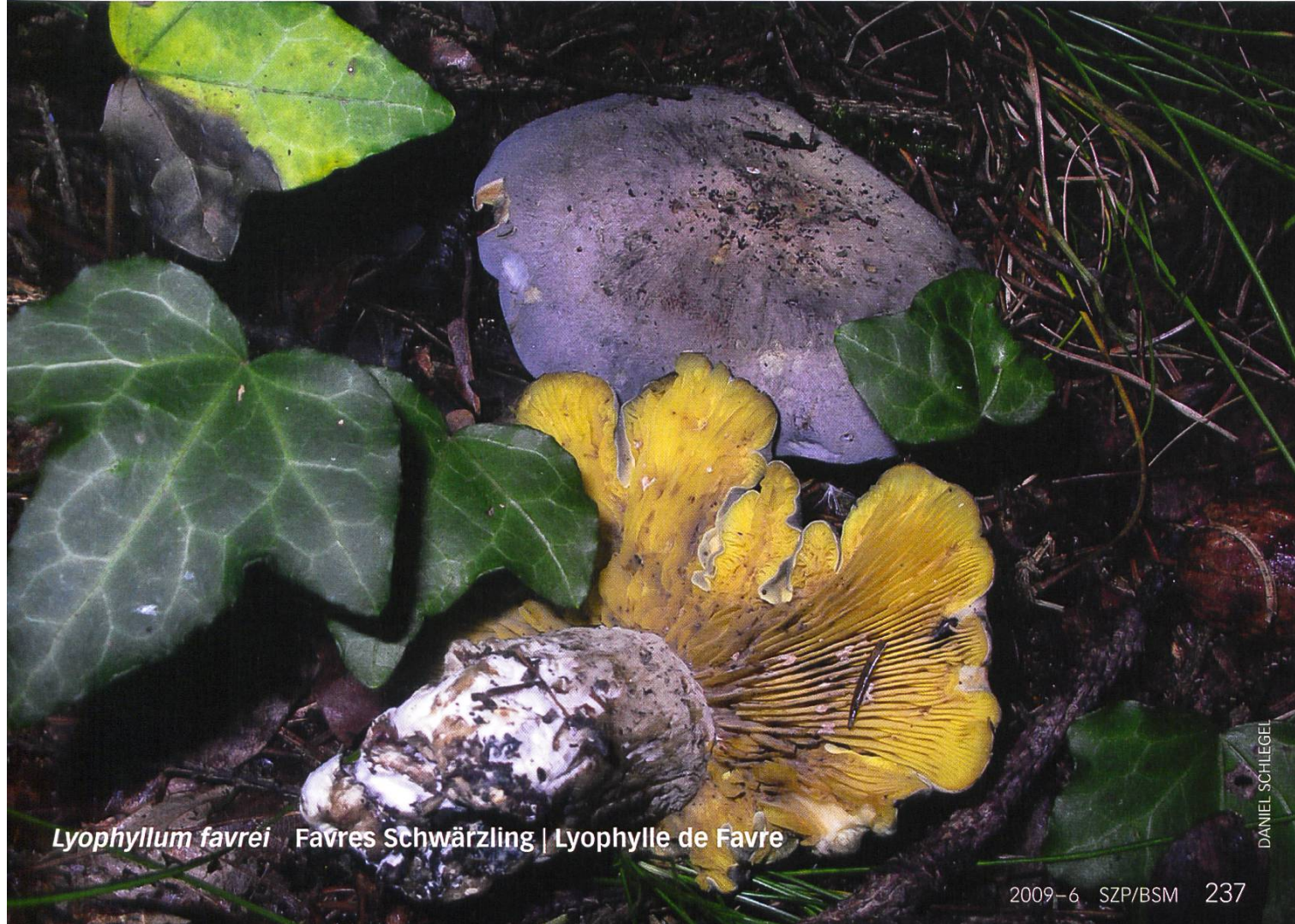
Lyophyllum favrei Favres Schwärzling | Lyophylle de Favre