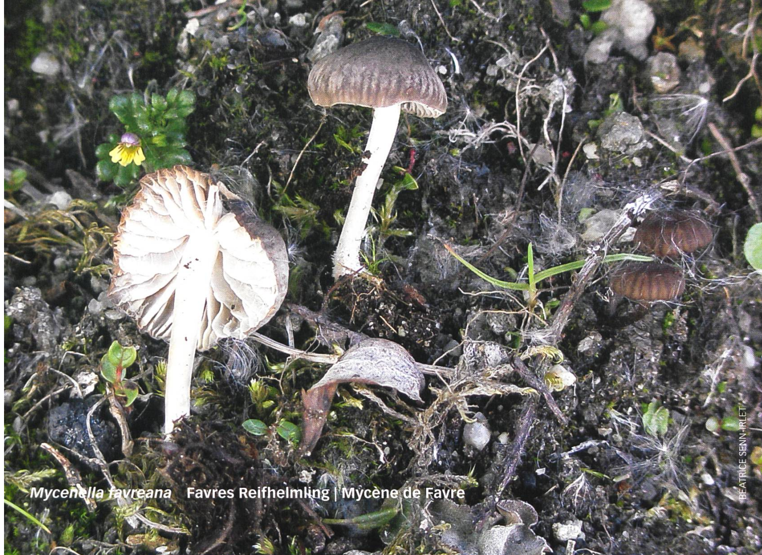
Mycenella favreana Favres Reifhelmling | Mycène de Favre