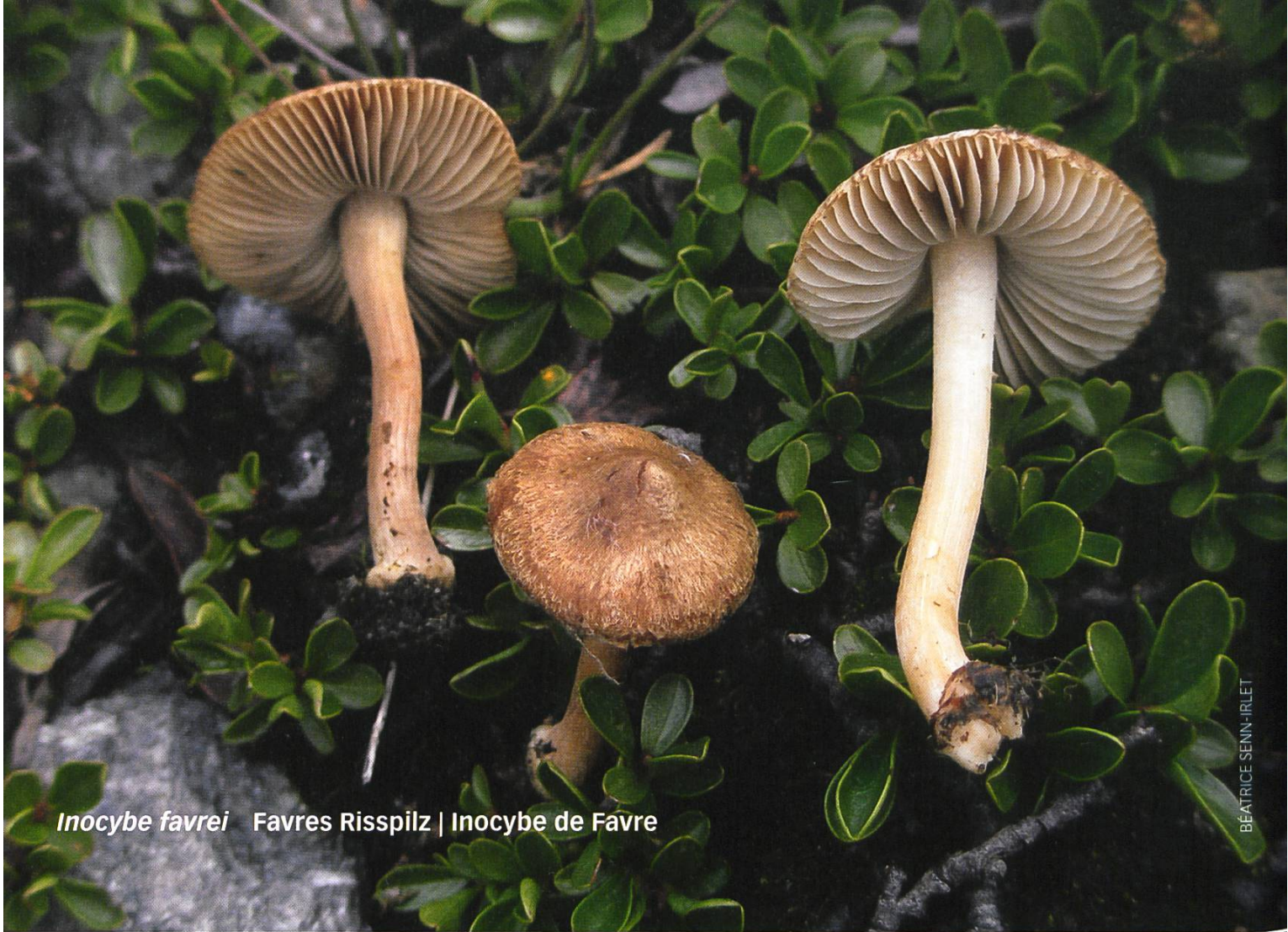
Inocybe favrei Favres Risspilz | Inocybe de Favre