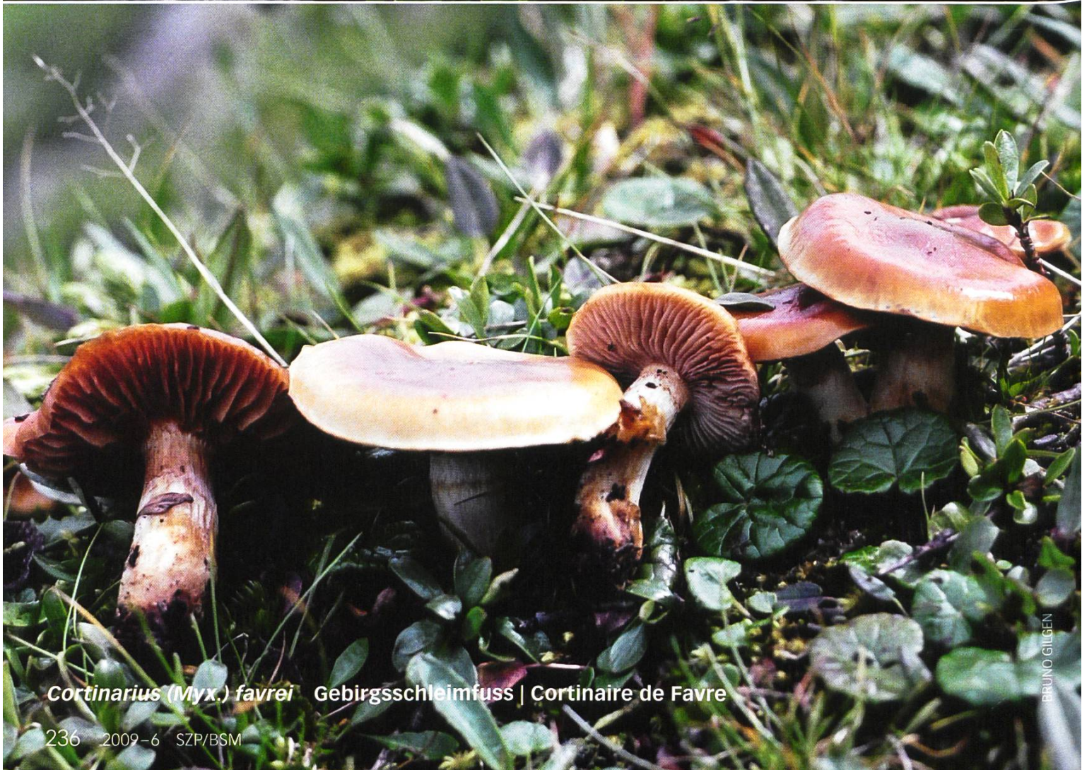
Cortinarius (Myx.) favrei Gebirgsschleimfuss | Cortinaire de Favre