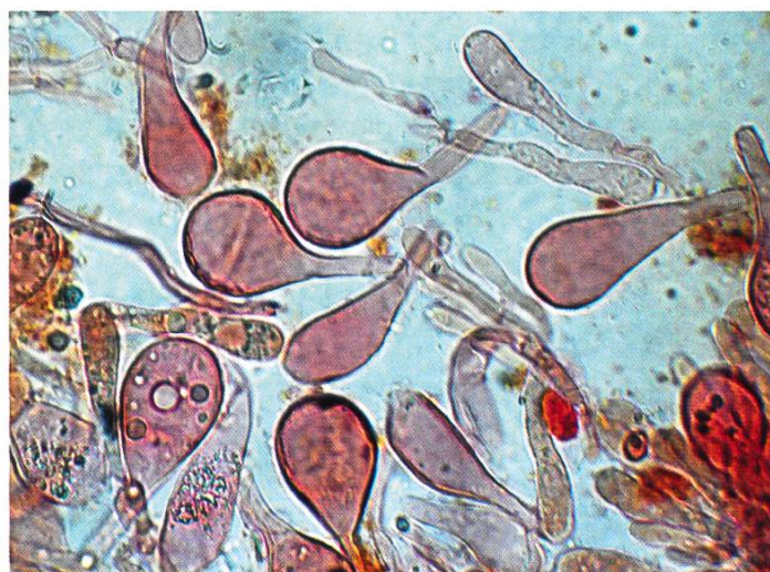
Tricholoma clavocystis residui di velo araneoso sulla superficie del gambo e cheilocistidi claviformi (-60 µm)