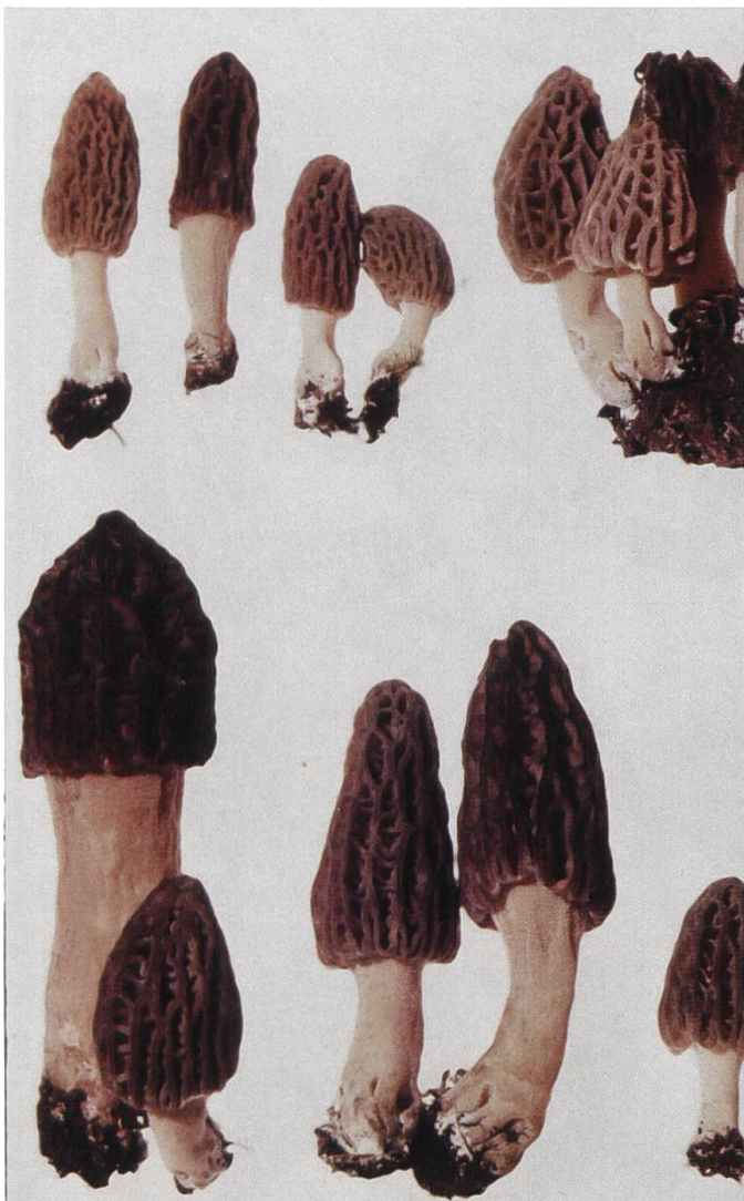
Morchella conica : Spitzmorchel | Morille conique