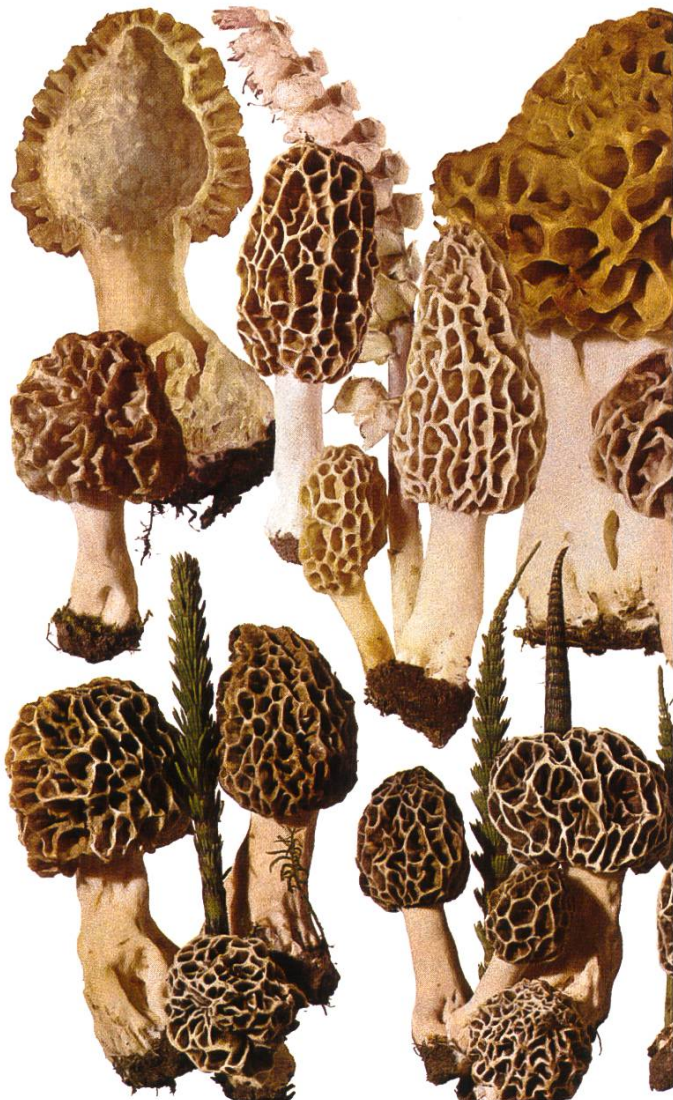
Morchella esculenta: Speisemorchel | Morille ronde

Celui qui étudie seul les Gyromitres ne peut comprendre que la confusion avec les morilles printanières est tout-à-fait possible. Les morilles élevées et les morilles rondes peuvent être confondues avec des Mitrophores et les Verpes de Bohême. A cela, il n'y a aucune conséquence funeste car tous comestibles avec une préparation culinaire correcte et une quantité raisonnable dans la consommation. Il ne faut simplement pas omettre le fait qu'une confusion avec les Gyromitres, elles, peuvent amener des conséquences sérieuses pour la santé.