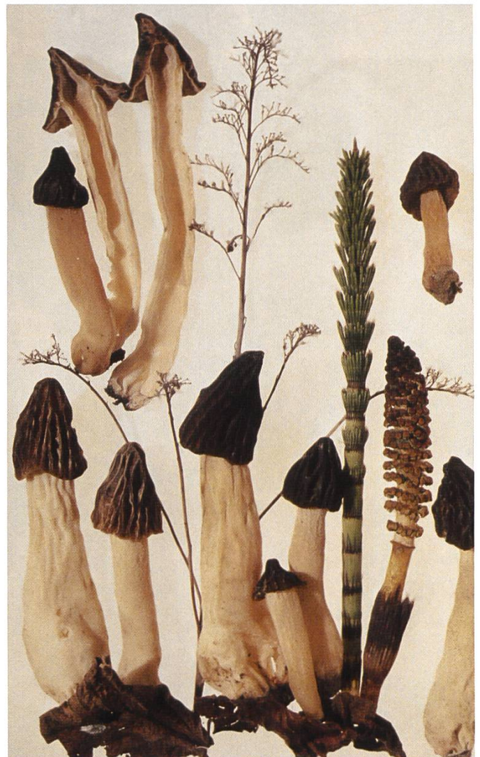
Mitrophora semilibera : Käppchenmorchel | Morillon