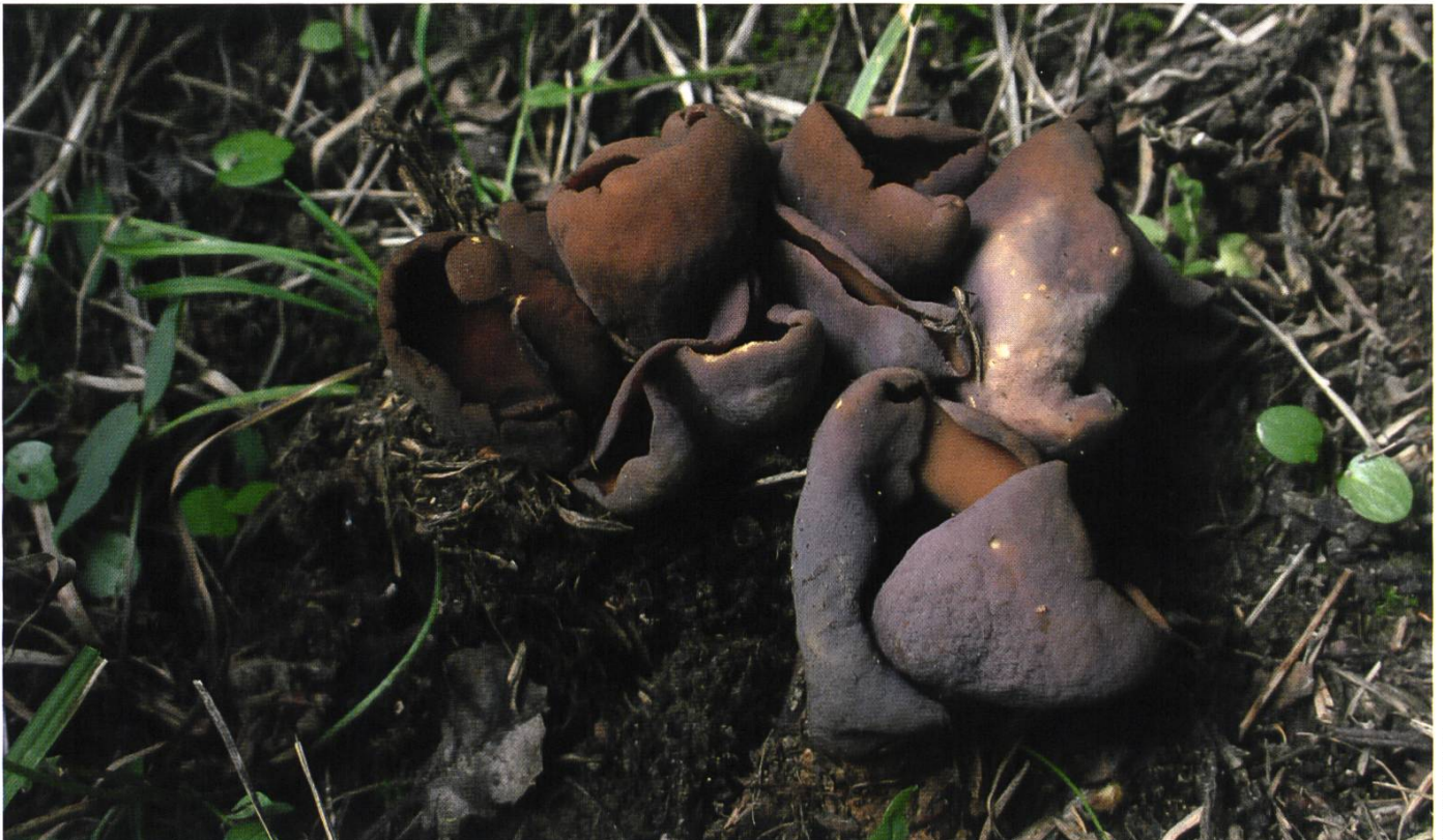
Otidea mirabilis Fruchtkörper | Ascocarpes

Grösse und Form der Fruchtkörper sind sehr variabel, ca. bis 40 mm hoch, mit lange eingerolltem, oft gekerbtem, fein gezähneltem Rand und einem bis zur Basis reichendem seitlichen, etwas eingerolltem Einschnitt. Fruchtschicht jung, orangegelbbraun, später mehr kaffeebraun, glatt. Aussenseite jung lila bis lilabraun, später dunkellila- bis dunkelmilchkaffeebraun, mit wenigen dunkelgelbbraunen, lilagelbbraunen wolkigen Stellen, kleiig, Basis weissfilzig. Einzeln bis gruppenweise in Büscheln zusammengedrängt wachsend, oft an der Basis miteinander verbunden und kaum vom Substrat zu trennen. Fleisch gelblich. Geruch unbedeutend. Feuchtes Papiertuch verfärbt sich schwefelgelb, an Stellen, wo die Fruchtkörper mit der Aussenseite zur Aufbewahrung aufgelegt sind.